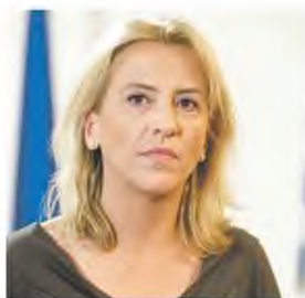
Η περιφερειάρχης Ρένα Δούρου

Χρηματοδοτήσεις συνολικού ύψους 14 εκατ. ευρώ ενέκρινε η Περιφέρεια Αττικής προκειμένου να εξοπλιστούν 21 δημόσια νοσοκομεία και να αναβαθμισθούν εννέα γήπεδα ποδοσφαίρου στην Αθήνα. Ο νοσοκομειακός εξοπλισμός θα προκύψει μέσα από την πρόσκληση (ΕΣΠΑ/ΠΕΠ) «Προμήθεια εξοπλισμού μονάδων Δευτεροβάθμιας και Τριτοβάθμιας φροντίδας Υγείας στην Περιφέρεια Αττικής», την οποία υπέγραψε η περιφερειάρχης Ρένα Δούρου και έχει συνολικό προϋπο-