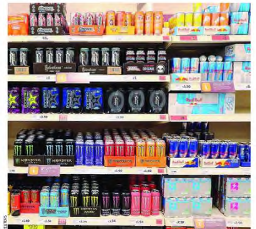
Το ενδεχόμενο να απαγορευτούν τα ενεργειακά ποτά για τα παιδιά εξετάζει η Βρετανία, τη στιγμή που η Ν. Κορέα απαγόρευσε τον καφέ στα σχολεία.

Η κυβέρνηση ξεκίνησε τη διαβούλευση αυτή για να ακουστούν οι απόψεις που υπάρχουν πάνω στο ζήτημα αυτό, συμπεριλαμβανομένων αυτών που θα αφορούν τις ηλικίες στις οποίες θα εφαρμοστεί το μέτρο αυτό. Η πολιτική αυτή θα ακολουθηθεί μόνον στην Αγγλία, ενώ η Σκωτία, η Ουαλλία και η Βόρεια Ιρλανδία είναι ελεύθερες να ορίσουν τις δικές τους πολιτικές για το θέμα αυτό. Η απαγόρευση θα εφαρμοστεί για τα ποτά που περιέχουν 150 χιλιοστόγραμμα καφεΐνης ή περισσότερο ανά λίτρο.