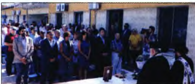
Από τον αγιασμό του Κέντρου Υγείας. Παράν και ο περιφερειάρχης Απ. Τζίτζικαΐστας

Στη Νέα Μηχανιώνα κινδύνευσαν το Κέντρο Υγείας, η