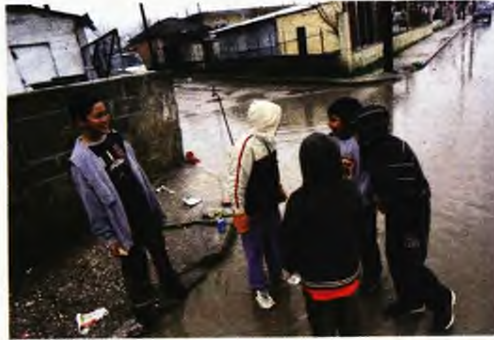
Παιδιά στον πλημμυρισμένο οικισμό των Ρομά