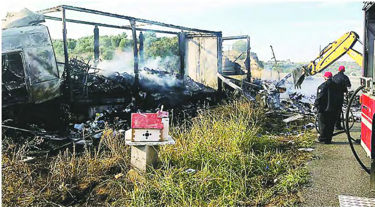
Πολλά τα εμπόδια για την ταφή των 11 ανθρώπων που έχασαν τη ζωή τους στο πολύνεκρο τροχαίο που έγινε το περασμένο Σάββατο στην παλαιά εθνική οδό Καβάλας-Θεσσαλονίκης