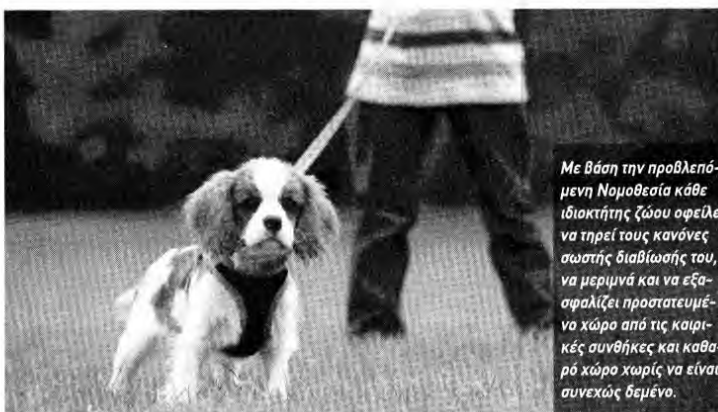
Με βάση την προβλεπόμενη Νομοθεσία κάθε ιδιοκτήτης ζώου οφείλει να τηρεί τους κανόνες σωστής διαβίωσής του, να μεριμνά και να εξασφαλίζει προστατευμένο χώρο από τις καιρικές συνθήκες και καθαρό χώρο χωρίς να είναι συνεχώς δεμμένο.