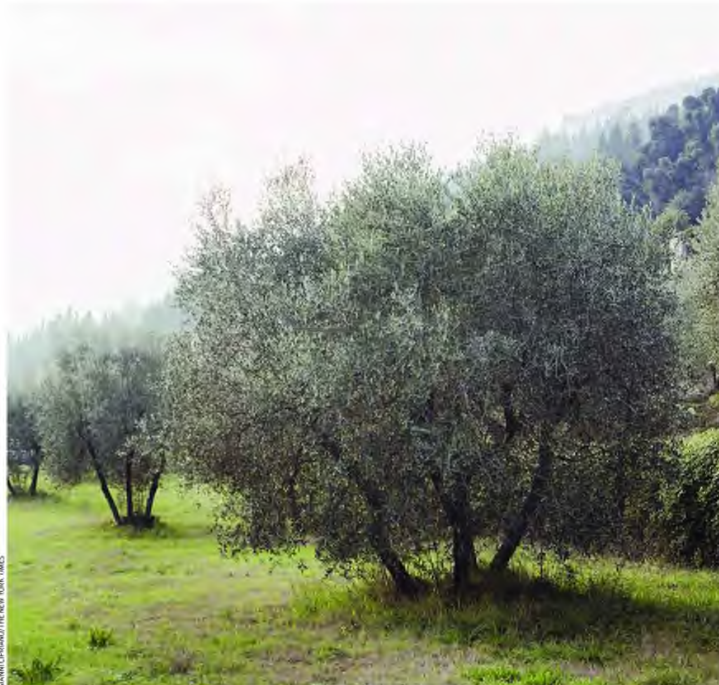
Τα ελαιόλαδα που έχουν υψηλή περιεκτικότητα σε ελαϊοκανθάλη (πιο μικρή γεύση, κάψιμο στον λαιμό) συνδέονται με μειωμένο κίνδυνο για καρκίνο, νόσο Αλτσχάιμερ και άλλες νευροεκφυλιστικές ασθένειες.

Τα ελληνικά ελαιόλαδα έχουν αυξημένες συγκεντρώσεις ελαϊοκανθάλης, αυτής της «θαυματουργής ουσίας», σύμφωνα με τον καθηγητή του Πανεπιστημίου Θεσσαλίας Δημήτρη Κουρέτα,