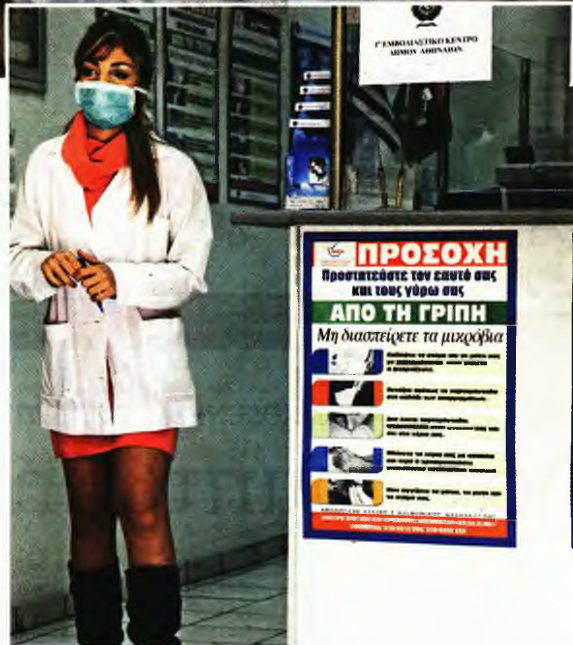
ΕΥΡΩΚΙΝΗΣΗ / ΧΑΡΙΣΜΑΚΗΣ ΒΑΙΩΣ