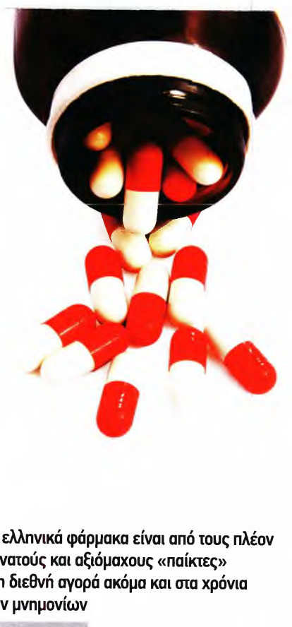
Τα ελληνικά φάρμακα είναι από τους πλέον δυνατούς και αξιόμαχους «παίκτες» στη διεθνή αγορά ακόμα και στα χρόνια των μνημονίων

κίνδυνο σχεδιαζόμενες επενδύσεις, θέσεις εργασίας και πάνω από όλα την πρόσβαση των ασθενών σε υπάρχοντα αλλά και σε μελλοντικά φάρμακα.