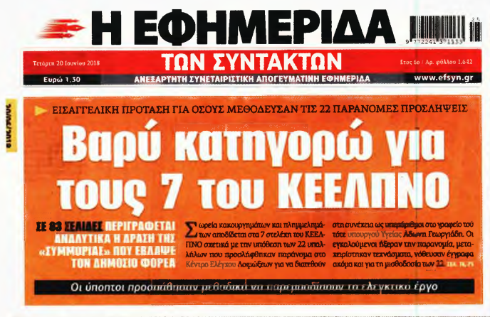
Το πρωτοσέλιδο της «Εφ.Συν.» στις 20/6/2018