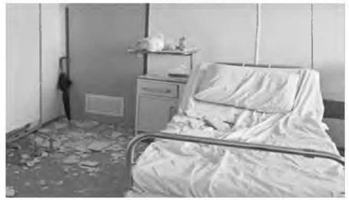
Οι εικόνες μέσα από το δωμάτιο της Ορθοπαιδικής στο Κρατικό Νοσοκομείο της Νίκαιας λίγο μετά την πτώση μέρους της οροφής του δωματίου που είχε ως αποτέλεσμα τον τραυματισμό μίας γυναίκας

Ο τομεάρχης Υγείας της Νέας Δημοκρατίας και βουλευτής Επικρατείας Βασίλης Οικονόμου, δήλωσε: «Είχαμε προαναγγείλει δημόσια ότι στο Γενικό Κρατικό της Νίκαιας θα είχαμε και ατυχήματα. Αλλά όπως φαίνεται, ο κ. Πολάκης με άλλα