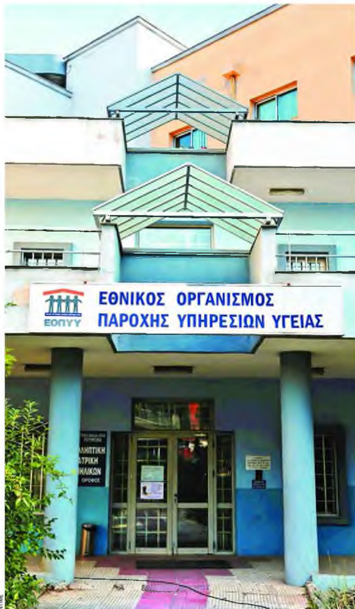
Πολλοί γιατροί των μονάδων Υγείας έχουν προσφύγει κατά της απόφασης του υπουργείου να τους «βαφτίσει» οικογενειακούς γιατρούς.

Ήδη η πλειονότητα των γιατρών που κινδυνεύουν με απόλυση έχει προσφύγει εκ νέου στη Δικαιοσύνη εναντίον του σχετικού νόμου του υπουργείου και την επόμενη εβδομάδα αναμένεται να εκδικαστούν οι υποθέσεις τους. Παράλληλα, η ομοσπονδία προσανατολίζεται και σε κινητοποιήσεις από τον Ιανουάριο. «Έχουμε το know-how (σ.σ.: γνωρίζουμε πώς να το κάνουμε)», είπε ο κ. Ψυχάρης, υπενθυμίζοντας την