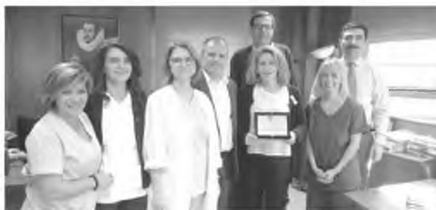
Η διοίκηση του Νοσοκομείου με το ανθρώπινο δυναμικό της ΜΕΘ και της νοσηλευτικής υπηρεσίας

Η επιχάλκωση της ΜΕΘ ξεκίνησε τον περίπου δύο χρόνια και έχει ολοκληρωθεί εδώ και ένα χρόνο, ενώ στο συνέδριο παρουσιάστηκαν τα μέχρι στιγμής αποτελέσματα της όλης υποδομής που έχει δημιουργηθεί και τα οποία είναι πολύ ενθαρρυντικά για την προστασία των ασθενών από ενδοноσοκομειακές λοιμώξεις. Το τριήμερο συνέδριο της ΠΑΣΥΝΟ-ΕΣΥ (η συνδικαλιστική και επιστημονική οργάνωση των νοσηλευτών πανελλαδικά) στόχευε στην