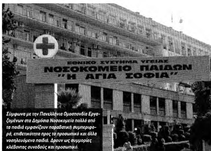
Σύμφωνα με την Πανελλήνια Ομοσπονδία Εργαζομένων στα Δημόσια Νοσοκομεία πολλά από τα παιδιά εμφανίζουν παραβατική συμπεριφορά, επιθετικότητα προς το προσωπικό και άλλα νοσηλευόμενα παιδιά. Δρουν ως συμμορίες κλέβοντας συνοδούς και προσωπικό.

Παράσταση διαμαρτυρίας πραγματοποιήσαν χθες έξω από το Νοσοκομείο Παιδών «Η Αγία Σοφία» γιατροί και νοσηλευτικό προσωπικό του ιδρύματος μαζί με μέλη της ΠΟΕΔΗΝ διαμαρτυρόμενοι για την επί μακρόν εγκατάλειψη ανηλίκων κατόπιν εισαγγελικής παραγγελίας. Με κεντρικό σύνθημα «Τη λύση οφείλει να δώσει η Πολιτεία και όχι οι εργαζόμενοι» το σωματείο υπαλλήλων του Παιδών «Η Πρόοδος», μάλιστα, εξέθεσε τα αιτήματά του και στη διοίκηση του νοσοκομείου, ενώ τα μέλη της καλούν τους συναδέλφους τους να συμμετέχουν μαζικά στην τριώρη κινητοποίηση τους