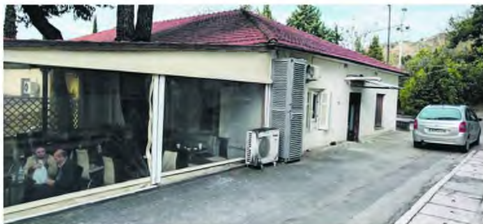
ΕΓΚΑΙΝΙΑ ΤΗΝ ΠΑΡΑΣΚΕΥΗ ΣΤΟ ΝΟΣΟΚΟΜΕΙΟ «ΑΓΙΟΣ ΔΗΜΗΤΡΙΟΣ»

Υπενθυμίζεται ότι στις αρχές Απριλίου 2017 ο «Ε.Τ.» είχε δημοσιεύσει ρεπορτάζ για την πρόθεση του Σωματείου Εργαζομένων να δημιουργήσει κοιτώνα φιλοξενίας. Είχε καταθέσει για πρώτη φορά το σχετικό αίτημα στις 8 Ιανουαρίου 2014. Το νοσοκομείο «Άγιος Δημήτριος» είναι ένα από σχετικά «μικρά» τ