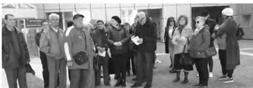
Η χθεσινή συγκέντρωση καρκινοπαθών της Μονάδας Χημειοθεραπείας στην είσοδο του Νοσοκομείου είχε συμβολικό χαρακτήρα

Α ψηφώντας το κρύο, με πρόσωπα αυλακωμένα από τον πόνο και τη ψυχολογική πίεση που προκαλεί η ασθένεια, αλλά αποφασισμένοι η φωνή τους να ακουστεί όσο πιο δυνατά γίνεται στα κέντρα λήψης των αποφάσεων, περισσότεροι από 50 καρκινοπαθείς κάθε ηλικίας συγκεντρώθηκαν συμβολικά στην είσοδο του Νοσοκομείου χτες το μεσημέρι, διεκδικώντας τη στελέχωση της Μονάδας Χημειοθεραπείας με περισσότερους γιατρούς.