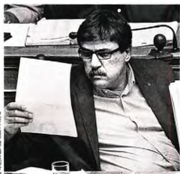
Ο υπουργός Υγείας Ανδρέας Ξανθός στα υπουργικά έδρανα της Βουλής

Δέκα εκατομμύρια ασφαλισμένοι εγκλωβισμένοι σ' ένα Πρωτοβάθμιο Σύστημα Υγείας καταδικασμένο να αποτύχει εξαιτίας των ελλείψεων