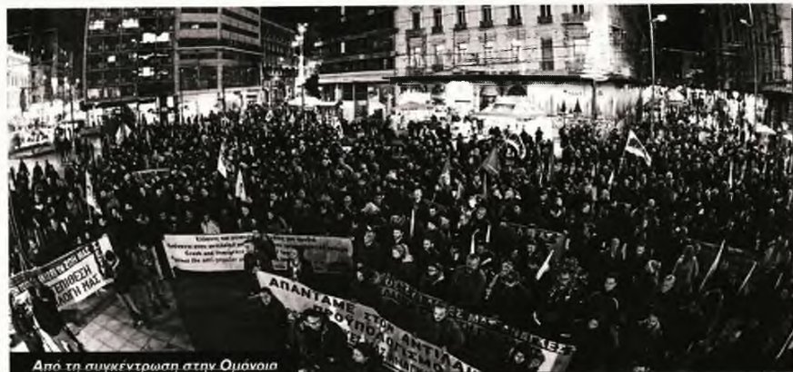
Από τη συγκέντρωση στην Ομόνοια

Από την κινητοποίηση δεν έλειψαν τα σωματεία των συνταξιούχων , που πριν από λίγες μέρες διαδήλωσαν διεκδικώντας την αποκατάσταση των συντάξεων και την κατάργηση όλων των αντιστασιατικών νόμων, κόντρα στις προπανανδιστικές παγίδες της κυβέρνησης. Πίσω από τα πανό των συλλόγων τους διαδήλωσαν φοιτητές που ανταποκρίθηκαν στο κάλεσμα του Μετώπου Αγώνα Σπουδαστών . Το δικό τους «παρών» έδωσαν στην