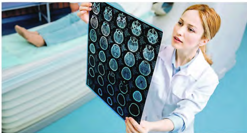
Δεν είναι μόνο οι εξετάσεις των καρκινοπαθών που βγαίνουν από το «συνταγολόγιο» των γενικών γιατρών, αφού ήδη τους έχουν απαγορευθεί και τα παραπεμπτικά για φυσικοθεραπείες