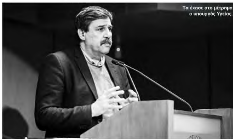
Τα έχασε στο μέτρημα ο υπουργός Υγείας.

Στο ίδιο μήκος κύματος και ο γενικός γραμματέας της Ομοσπονδίας Ενώσεων Νοσοκομειακών Γιατρών Ελλάδος (ΟΕΝΓΕ), Παναγιώτης Παπανικολάου, ο οποίος υποστηρίζει ότι «ακόμη και τόσοι μόνιμοι γιατροί να έχουν προσληφθεί, δεν έχει αλλάξει κάτι, γιατί άλλοι τόσοι έχουν αποχωρήσει». Οι συνταξιοδοτήσεις γιατρών ανέρχονται σε περίπου 300-400 ετησίως, ενώ οι συνταξιοδοτήσεις λοιπού προσωπικού των νοσηλευτικών ιδρυμάτων ανέρχονται σε 1.100-1.300 κάθε χρόνο. Μάλιστα, το 2019 και το 2020 θα είναι μια δύσκολη χρονιά για το ιατρικό δυναμικό των νοσηλευτικών ιδρυμάτων, καθώς αναμένεται μαζικό κύμα αποχωρήσεων, που