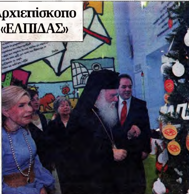
Ο Αρχιεπίσκοπος Ιερώνυμος με τη Μαριάννα Βαρδινογιάννη, πρόεδρο του Συλλόγου Φίλων Παιδιών με Καρκίνο

Παράλληλα έκανε αναφορά στη συνεργασία με την Εκκλησία στον τομέα εθελοντικής προσφοράς μυελού των οστών. Από την πλευρά