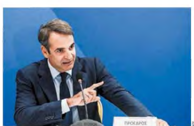
«Δεν μπορεί να γίνει ανεκτό σε ένα κράτος δικαίου να χαρακτηρίζεται από τη Δικαιοσύνη προστατευόμενος μάρτυρας πρόσωπο που βαρύνεται με κατηγορίες, ενώ ο νόμος ρητώς το απαγορεύει», τόνισε ο κ. Μητσοτάκης.

Της ΑΡΙΣΤΟΤΕΛΕΙΑΣ ΠΕΛΛΩΝ Ηκρή παρέμβαση για τις πρωτοφανείς δηλώσεις Πολάκη και όσα διαμείβονται γύρω από την υπόθεση Novartis έκανε ο Κυριάκος Μητσοτάκης, υποθετώντας επί της ουσίας την προειδοποίηση της Ένωσης Δικαστών και Εισαγγελέων περί θεσμικής εκτροπής και καλότητας τόσο τους λειτουργούς της Δικαιοσύνης, όσο και τις δημοκρατικές δυνάμεις της χώρας για την απερέψουν και να «υψώσουν αντιστοιχία». Ο κ. Μητσοτάκης έκανε λόγο για «πρωτοφανή υπονόμηση των δημοκρατικών μας θεσμών» και ευθεία απηλ στη διάκριση των εξουσιών στη χώρα. Αναφερόμενος στις επιμαχες αναρτήσεις Πολάκη –για τις οποίες σημειώνεται ότι η κυβέρνηση ουδέποτε έλαβε επίσημο θέση– υπογράμμισε: «Δεν μπορεί να γίνεται ανεκτό σε ένα κράτος δικαίου εν ενεργεία υπονόμηση να απειλεί ονομαστικά εισαγγελλείς και ανακριτές ότι δεν επιτελούν την αποστολή τους, όπως ο ίδιος θα επιθυμούσε, και ο πρωθυπουργός να τον καλύπτει. Ούτε μπορεί να γίνει ανεκτό σε ένα κράτος δικαίου να χαρακτηρίζεται από τη Δικαιοσύνη προστατευόμενος μάρτυρας πρόσωπο που βαρύνεται με κατηγορίες, ενώ ο νόμος ρητώς το απαγορεύει», τόνισε ο κ. Μητσοτάκης.