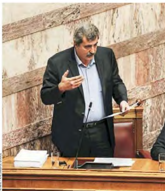
ΑΠ. ΜΠΕ / ΑΓΕΝΩΣΤΟ ΒΛΑΝΣ

Ο υπουργός Δικαιοσύνης Μιχάλης Καλογήρου, ο οποίος διακρίνεται για θεσμικό λόγο σε ό,τι αφορά την τοποθέτησή του σε θέματα δικαιοσύνης, επιχειρήσει από την πλευρά του να αμβλύνει τις αρνητικές εντυπώσεις που έχουν προκληθεί από τις αναρτήσεις Πολάκη και να υπερασπιστεί ως επίσημη θέση της κυβέρνη-