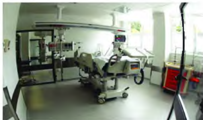
Η ανακοίνωση της ΠΟΕΔΗΝ κάνει λόγο για «τριτοκοσμικές συνθήκες» μέσα στα Νοσοκομεία

Διασωληνωμένοι ασθενείς στη Νευροχειρουργική κλινική σε τετράκλινους θαλάμους με άλλους ασθενείς περιμένουν ΜΕΘ σε λίστα αναμονής. Έμπαζαν οι πόρτες στους διαδρόμους με τους ασθενείς να ξεπαγιάζουν. Έως 8μμ είχαν γίνει 205 εισαγωγές ασθενών. Στη βραχεία νοσηλεία επικρατούσε το αδιαχώρητο από Ασθε-