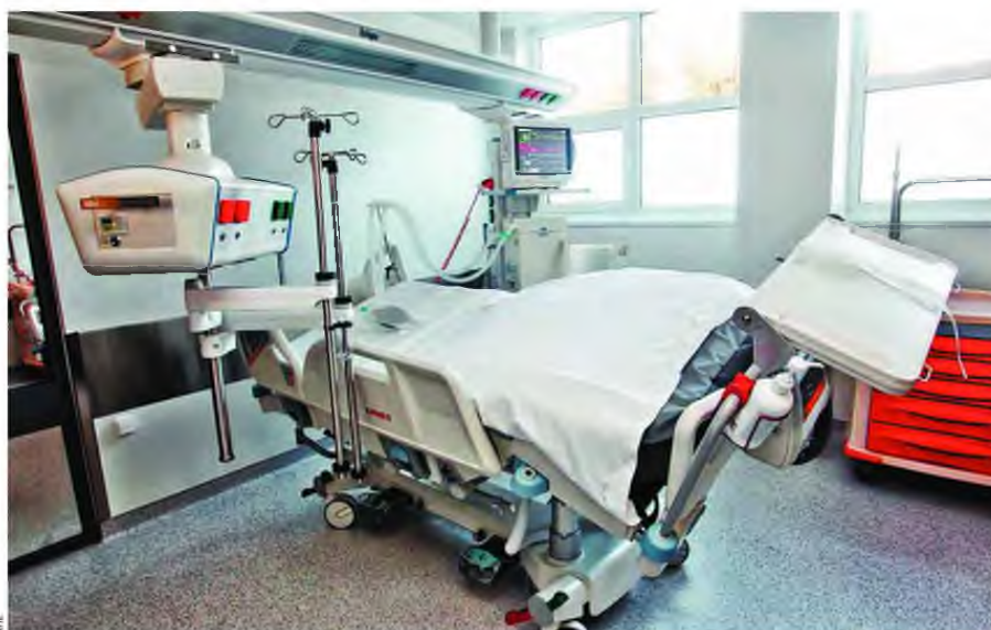
Στα νοσοκομεία του ΕΣΥ λειτουργούν περίπου 540 κλίνες ΜΕΘ, 150 λιγότερες από αυτές που προβλέπονται.

Από τους τέσσερις ασθενείς που έχουν καταλήξει από τις αρχές της φετινής περιόδου έως και τη δεύτερη εβδομάδα του Ιανουαρίου λόγω γρίπης, ένας δεν νοσηλεύθηκε σε Μονάδα Εντατικής Θεραπείας. Άλλη μία χρονιά