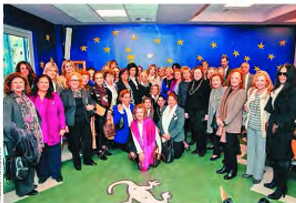
Μέλη της «Παναθηναϊκής» Οργάνωσης Γυναικών και της «Ελπίδας».

Τα καλά νέα συνεχίζονται: Τον θεμέλιο λίθο για τη δημιουργία μιας ευρύτερης συνεργασίας έβαλαν οι Έλληνες Πρόσκοποι και η «Ελπίδα». Στόχος