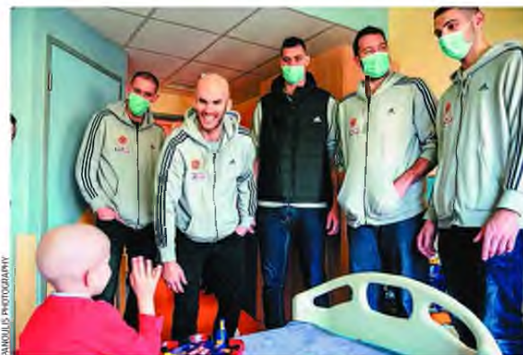
Οι παίκτες μπάσκετ του Παναθηναϊκού συναντούν τα παιδιά.