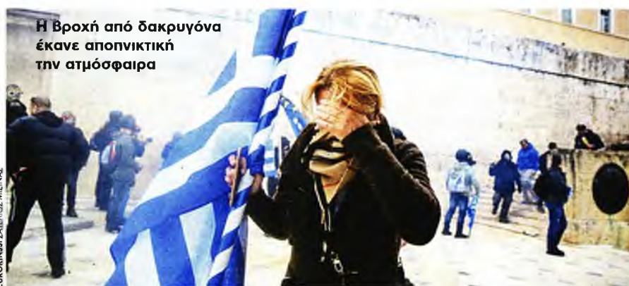
Η βροχή από δακρυγόνα έκανε αποπνικτική την ατμόσφαιρα