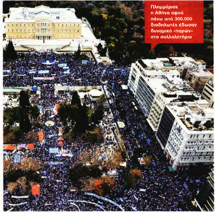
Πλημμύρισε η Αθήνα αφού πάνω από 300.000 διαδηλωτές έδωσαν δυναμικό «παρών» στο συλλαλητήριο