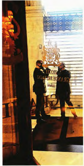
Το προσωπικό της Μεγάλης Βρεταννίας με μάσκες οξυγόνου