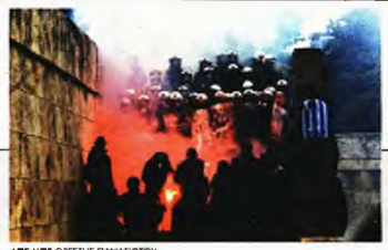
ΑΠΕΜΠΕ ΟΡΕΣΤΗΣ ΠΑΝΑΓΙΩΤΟΥ