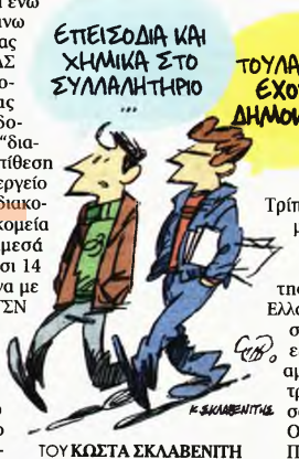
ΤΟΥ ΚΩΣΤΑ ΣΚΛΑΒΕΝΤΗ

Αν και το συλλαλητήριο διακόπηκε αιφνιδιαστικά και βιαιώς, οι πρώτες εκτιμήσεις έκαναν λόγο για πάνω από 300.000 διαδηλωτές, ωστόσο επίσημος η Αστυνομία αρχικά «μέτρησε» 100.000 συγκεντρωμένους και γρήγορα έριξε τον αριθμό σε 60.000. «Το όνομά μας είναι η ψυχή μας», «Τώρα μιλάει ο ελληνικός λαός», «Μακεδονία, γη ελληνική» έγραφαν τα πανό ανθρώπων που ταξίδεψαν με εκατοντάδες πολύμαν από κάθε γωνιά της χώρας, ενώ δυναμικό «παρών» έδωσαν οι Βορειοπρωτογενείς και η Ομογένεια (ακόμα και από Σιγκαπούρη και Καναδά). «Δεν κάνουμε κάτι σπουδαίο, κάνουμε το χρέος μας. Γίνονται επικίνδυνα πράγματα και πρέπει να φωνάξουμε» είπε ο Γιώργος Σκούρδος που ζει στην Ελβετία (με καταγωγή από την Τρίπολη). «Θα συνεχίσουμε τις επόμενες μέρες με κινητοποιήσεις. Οι αξίες, η καρδιά μας, ο νους μας δεν μπορεί να παραδοθούν» τόνισε ο πρόεδρος της Παμμακεδονικής Συνομοσπονδίας Ελλάδας Ιωάννης Αθανασιάδης. Ανάμεσα σε όσους ανέβηκαν χθες στην κεντρική εξέδρα ήταν ο πρόεδρος της Ελληνοαμερικανικής Ένωσης Κρις Σπύρου, η τραγουδίστρια Αφροδίτη Μάνου, εκπρόσωπος της τερράς κοινότητας του Αγίου Ορους, ο πρόεδρος της ΚΕΔΕ Γιώργος Πατούλης κ.ά.