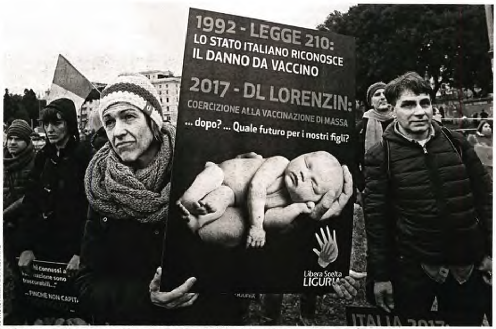
Ιταλοί διαμαρτύρονται εναντίον των παιδικών εμβολιασμών στη Ρώμη