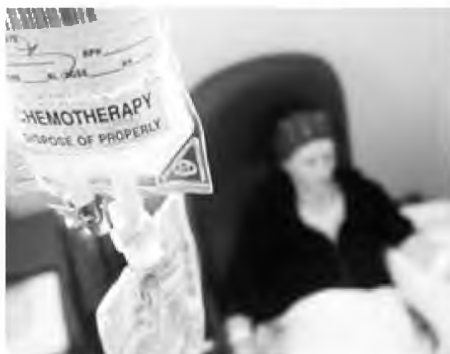
Ο μοναδικός επικουρικός γιατρός της Μονάδας «κρέμασε» χθες την ποδιά του

Μετά τις παραπάνω εξελίξεις, από σήμερα 1η Φεβρουαρίου