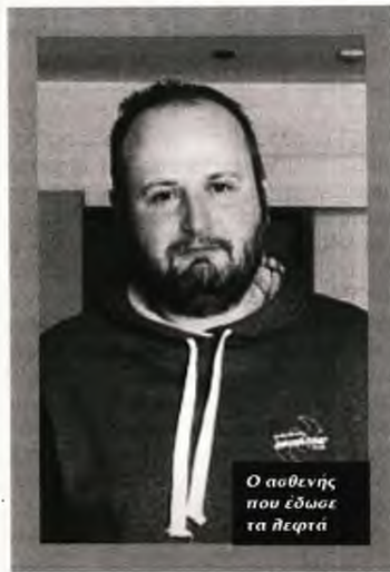
Ο ασθενής που έδωσε τα λεφτά

Τιμήθηκε με την εκφώνηση του «Όρκου του Ιπποκράτη» κατά την τελετή αποφοίτησης, λόγω του