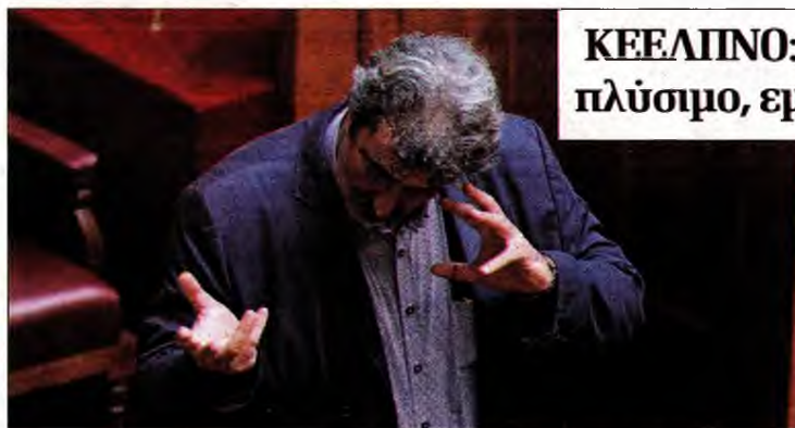
Ο Παύλος Πολάκης προσπαθώντας να εξηγήσει τα ανεξήγητα

Την ίδια ώρα που τα ράφια των φαρμακείων είναι άδεια από αντιγριπικά εμβόλια και οι ειδικοί του ΚΕΕΛΠΝΟ προειδοποιούν για ραγδαία αύξηση των θανάτων από τον επιθετικό ιό της γρίπης Α Η1Ν1, ο αναπληρωτής υπουργός Υγείας Παύλος Πολάκης «χτύπησε» πάλι με το γνωστό κυνικό ύφος του, προκα-