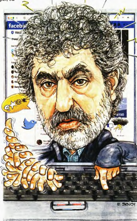
ΤΗΣ ΕΦΗΣ ΞΕΝΟΥ