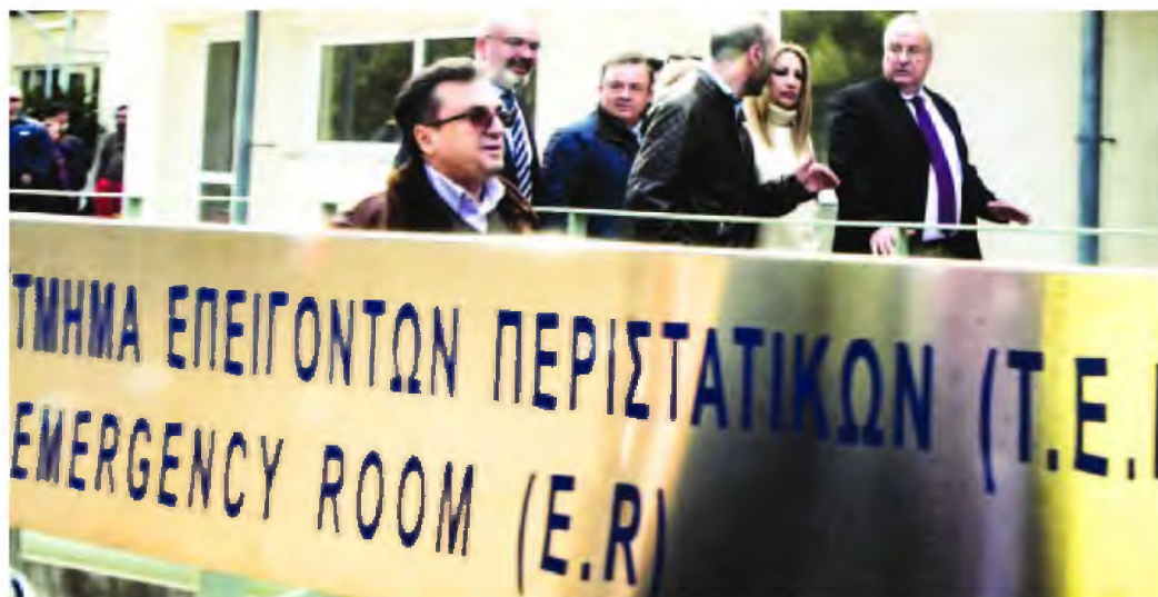
Η Φώφη Γεννηματά κατά την επίσημή της στο Νοσοκομείο «Σωτηρία»

«Και νομίζω αυτή είναι η κατάσταση που βιώνουν και οι χρήστες του Συστήματος Υγείας και η οποία δεν τιμά το δημόσιο Σύστημα Υγείας. Αυτό επιβεβαιώνεται και από τις ελλείψεις σε προσωπικό, τις συνθήκες εργασίας των εργαζόμενων συνολικά στα δημόσια νοσοκομεία και τα προβλήματα που αντιμετωπίζουν με τον ελλιπή εξοπλισμό. Η εικόνα που παρουσιάζεται είναι ενός συστήματος το οποίο φτάνει πια στα όριά του, αν δεν τα έχει ήδη ξεπεράσει» υπογράμμισε.