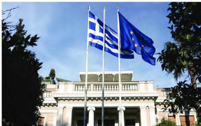
Σφοδρή επίθεση εξαπέλυσε η ΠΟΕΔΗΝ κατά της κυβέρνησης και του πρωθυπουργού Αλ. Τσίπρα

Η κλήση, όπως λένε, έγινε για να εξεταστούν ανομοτί στο πλαίσιο διενεργούμενης προκαταρκτικής εξέτασης με αδικήματα τον μισό Ποινικό Κώδικα, όπως διατάραξη ειρήνης,