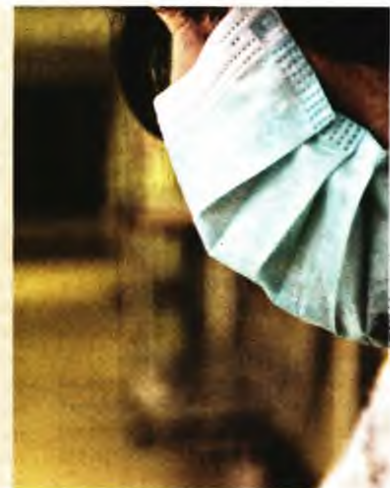
ΕΥΡΟΚΝΙΣΣΙ / ΓΙΑΝΝΗΣ ΠΑΝΑΓΙΩΤΟΥΔΙΣ