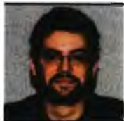
Του ΓΙΩΡΓΟΥ ΚΑΛΙΝΗ

Μ ια νέα εποχή αρχίζει για την αντιμετώπιση του καρκίνου του τραχήλου της μήτρας, με τον έλεγχο των γυναικών με HPV DNA test μέσω αυτολήψης, να αποδεικνύεται το ίδιο αποτελεσματικός με τον έλεγχο ενός γιατρού, σύμφωνα με τα αποτελέσματα του προγράμματος GRECO-SELF, τα οποία παρουσιάστηκαν χθες κατά τη διάρκεια συνέντευξης τύπου.