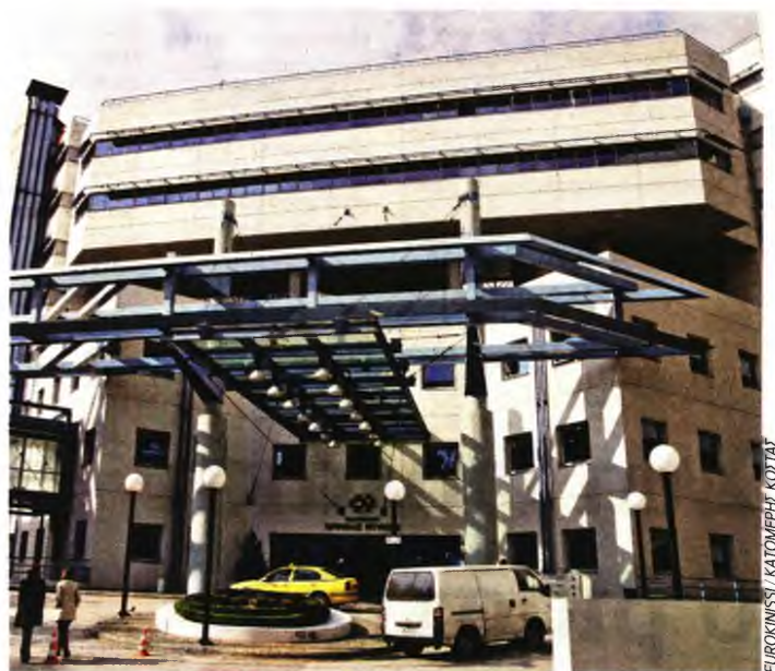
ΕΥΡΟΚΙΝΗΣΗ / ΚΑΤΟΜΕΡΗΣ ΚΟΥΖΙΛ

Αν και το Ίδρυμα Ωνάσης έχει ήδη καταθέσει προσφορά ύψους 88 εκατ. ευρώ για την αγορά του «Ντυνάν», η ιδιοκτήτρια Τράπεζα Πειραιώς αλλά και η διοίκηση του νοσοκομείου «παίζουν καθυστερήσεις» , δεν ζητούν επανεκτίμηση της αξίας του και προσπαθούν να ματαιώσουν τη μεταβίβαση, με το βλέμμα εμφανώς στις επερχόμενες εκλογές