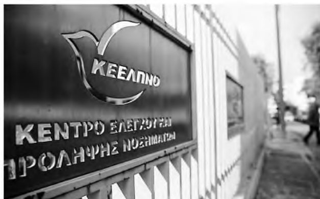
Ο Εθνικός Οργανισμός Δημόσιας Υγείας, που θα αντικαταστήσει το ΚΕΕΛΠΝΟ , θα διοικείται από επταμελές διοικητικό συμβούλιο, το οποίο θα διορίζεται με απόφαση του υπουργού Υγείας

Συγκεκριμένα σημειώνεται: «Σκοπός του ΕΛΚΕ είναι η διαχείριση και η διάθεση κονδυλίων που προέρχονται από οποιαδήποτε πηγή, καθώς και από ίδιους πόρους του, και προορίζονται για την κάλυψη δαπανών οποιουδήποτε είδους, που είναι απαραίτητες για τις ανάγκες εκτέλεσης έργων ερευνητικών, εκπαιδευτικών, επιμορφωτικών, αναπτυξιακών, καθώς και έργων συνεχιζόμενης κατάρτισης, σεμιναρίων και συνεδρίων, παροχής επιστημονικών και τεχνολογικών υπηρεσιών, εκπόνησης ειδικών και κλινικών μελετών, εκτέλεσης δοκιμών, μετρήσεων, εργαστηριακών εξετάσεων και αναλύσεων, παροχής γνωμοδοτήσεων, σύνταξης προδιαγραφών για λογαριασμό τρίτων».