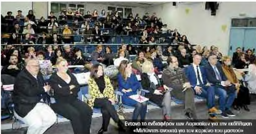
Έντονο το ενδιαφέρον των Λαρισαίων για την εκδήλωση «Μιλάμε ανοικτά για τον καρκίνο του μαστού»