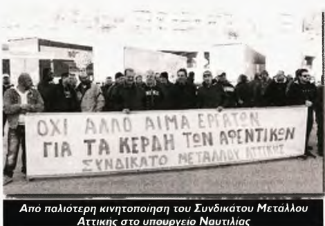
Από παλιότερη κινητοποίηση του Συνδικάτου Μεταλλού Αττικής στο υπουργείο Ναυτιλίας

Στο μεταξύ, εργατικό «ατύχημα» στην επιχείρηση ΣΥΝΚΟ - ΑΓΡΟ-