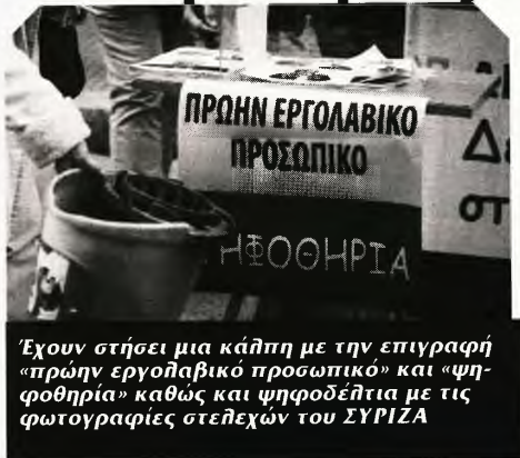
Έχουν στήσει μια κάππη με την επιγραφή «πρώην εργολαβικό προσωπικό» και «ψηφοθηρία» καθώς και ψηφοδέλτια με τις φωτογραφίες στελεχών του ΣΥΡΙΖΑ