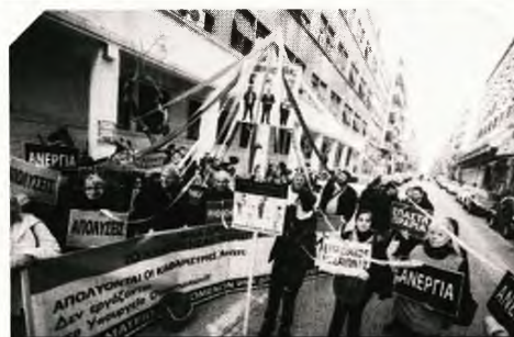
Οι συγκεντρωμένοι έστησαν έξω από το υπουργείο Υγείας γαϊτανάκι με τις φωτογραφίες του αναπληρωτή υπουργού Υγείας Παύλου Πολάκη, της ευρωβουλευτού του ΣΥΡΙΖΑ Κωνσταντίνης Κούνεβα και του πρωθυπουργού Αλέξη Τσίπρα.

Ειδικότερα, σε μια συμβολική κίνηση οι συγκεντρωμένοι έστησαν χθες έξω από το υπουργείο Υγείας γαϊτανάκι με τις φωτογραφίες του αναπληρωτή υπουργού Υγείας Παύλου Πολάκη, της ευρωβουλευτού του ΣΥΡΙΖΑ Κωνσταντίνης Κούνεβα και του πρωθυπουργού Αλέξη Τσίπρα, ενώ κρατούσαν πλακάτ με τις λέξεις «ομηρία», «ανεργία», «ψηφοθηρία», «απολύσεις», «εργασιακός μεσαιώνας», «σπαστά ωράρια». Επιπλέον, είχαν στήσει μια κάππη με την επιγραφή «πρώην εργολαβικό προσωπικό» και «ψηφοθηρία» καθώς και ψηφοδέλτια με τις φωτογραφίες στελεχών του ΣΥΡΙΖΑ. Όπως σημειώνει από την πλευρά του ο πρόεδρος της ΠΟΕΔΗΝ Μιχάλης Γιαννάκος, συνολικά 7.000 εργαζόμενοι συμβασιούχοι των δημοσίων νοσοκομείων βρίσκονται αντιμετώπι με τον εφιάλτη της ανεργίας μόλις λήξει η σύμβαση τους. Ειδικότερα, η διαμαρτυρία αφορά σε περίπου 160 συμβασιούχους της καθαριότητας σε Δρομοκαίτειο και