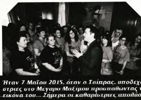
Ήταν 7 Μαΐου 2015, όταν ο Τσίπρας, υποδεχόταν τις καθαρίστριες στο Μέγαρο Μαξίμου προπαθώντας να ενισχύσει την εικόνα του... Σήμερα οι καθαρίστριες απολύονται...