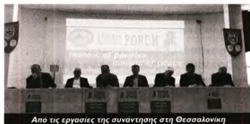
Από τις εργασίες της συνάντησης στη Θεσσαλονίκη

Οι εργασίες ολοκληρώθηκαν με την έκδοση κοινής απόφα-