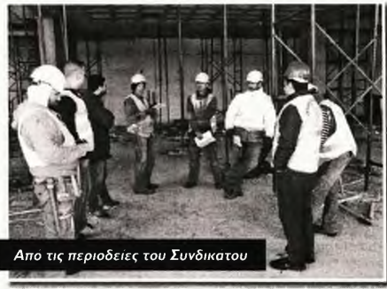
Απο τις περιοδικές του Συνδικάτου

Περιοδικές σε μια σειρά εργαζόμενα όργανα - σε το Συνδικάτο Οικοδόμων Αθήνας την περασμένη Παρασκευή, συζητώντας με τους εργαζόμενους γύρω από τα επόμενα βήματα στον αγώνα για την υπογραφή Συλλογικών Συμβάσεων Εργασίας (ΣΣΕ). Περιοδικές έγιναν συγκεκριμένα στα εργαζόμενα επέκτασης του Αεροσταθμού του Αεροδρομίου «Α. Βενιζέλος», του εκπατοικού χωριού στα Σπάτα και της κατασκευής φαρμακευτικής εταιρείας στο Κορωπί.