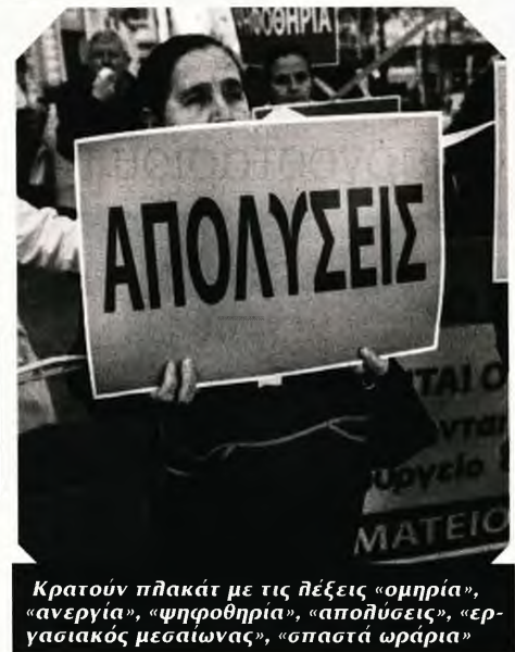
Κρατούν πλακάτ με τις λέξεις «ομηρία», «ανεργία», «ψηφοθηρία», «απολύσεις», «εργασιακός μεσαιώνας», «σπαστά ωράρια»