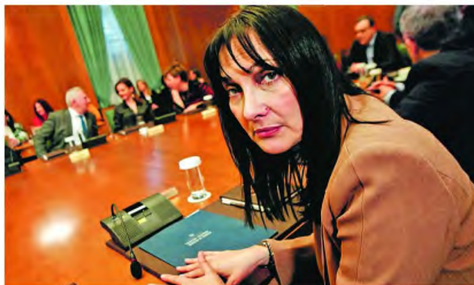
Δεν τον συμπαθώ , αλλά η φωτογραφία αυτή ομολογουμένως του ανήκει. Αφιερωμένη, λοιπόν, στον Πάνο Καμμένο...

αξίζει να σταθούμε λίγο στον τρόπο με τον οποίο κρίνουν τον Κρητικό του Κραουνάκη οι συνάδελφοί του στον ΣΥΡΙΖΑ. Εκτός από τους ως άνω προαναφερθέντες θαυμαστές του, ξεχωρίζουν οι εξής: Πρώτα, η Σία Αναγνωστοπούλου, για την οποία όλος ο θόρυβος συμβαίνει για τον λόγο ότι ο περί ου ο λόγος έχει «μεγάλο λαϊκό έρεισμα». Επειδή αυτό μόνο ένας Μπάρκας θα ήταν ικανός να το πει, συμπεραίνω ότι η Σία έχει ακόμη το hangover της υπουργοποίησης.