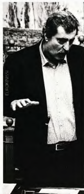
Αγωγή κατά του Παύλου Πολάκη καταθέτει η ΠΟΕΔΗΗ και άλλοι συνδικαλιστές από το χώρο της Υγείας.

2 Την επιδότηση δόσης που περιλαμβάνεται στο νέο σχέδιο για την προστασία της α' κατοικίας που θα αντικαταστήσει το νόμο Κατσέλη, που, όπως είχε ο κ. Τσίπρας, θα έχει συνολικό ετήσιο προϋπολογισμό 200 εκατομμύρια ευρώ και θα αφορά περίπου 180.000 νοικοκυριά. Σύμφωνα με τα όσα είχε ο πρωθυπουργός, «το κράτος αναλαμβάνει την υποχρέωση να επιδοτεί τη δόση του δανείου, ενώ οι τράπεζες αναλαμβάνουν να μειώσουν τη δόση με μείωση επιτοκίου και επιμήκυνση του δανείου». ■