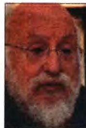
Ο αναπληρωτής υπουργός Υγείας Παύλος Πολάκης στο βήμα του Κοινοβουλίου. Αριστερά: Ο Διονύσης Σαββόπουλος, που ήρθε σε οξεία αντιπαράθεση με τον υπουργό. Δεξιά: Ο Θανάσης Παπαχριστόπουλος

Το συγκεκριμένο δημοσίευμα χρησιμοποίησε σχεδόν αυτολεξεί η Ν.Δ. διατηρώντας το θέμα ψηλά στην επικαιρότητα. Έθεσε, μάλιστα, τέσσερα ερωτήματα στο Μέγαρο Μαξίμου, όσον αφορά το ύψος του δανείου, την επιλογή της Τράπεζας Αττικής να χορηγήσει ένα τέτοιο δάνειο, το τηλεφώνημα στον κεντρικό τραπέζιτη και όσα γράφτηκαν για τη μαγνητοφώνηση της συνομιλίας. «Και είναι δυνατόν, ενώ έχει εμφανιστεί πλήρως ο διάλογος, να υποστηρίζεται ότι δεν ηχογράφησε τη συνομιλία τους;» ανα-