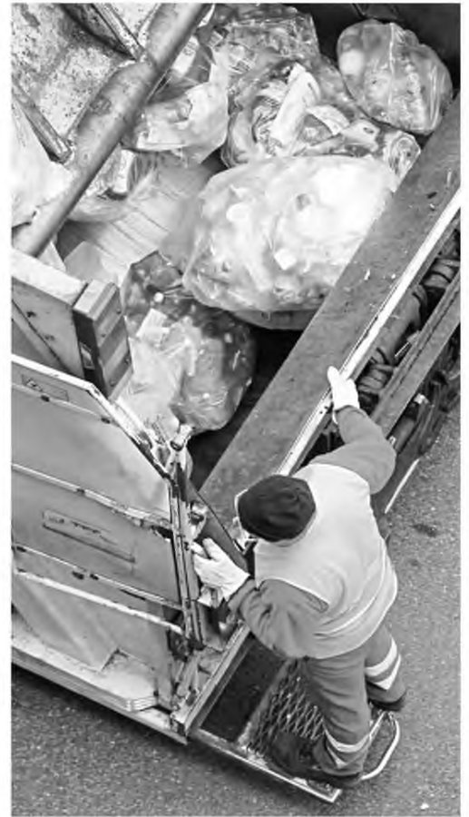
Εως το τέλος του χρόνου τίποτα δεν αλλάζει για εργαζόμενους εκτεθειμένους σε αντίξοες συνθήκες, όπως η αποκομιδή απορριμμάτων, τα δημόσια ουρητήρια και οι εκταφές νεκρών

Το κείμενο της τροπολογίας που αφορά και άλλα θέματα υπογράφουν οι υπουργοί Εσωτερικών Αλέξης Χαρίσιος, Εργασίας Εφρ Αχτσιόγλου, Δικαιοσύνης Μιχάλης Καλογιάνης, Οικονομικών Ευκλείδης Τσακαλώτος, Υγείας Ανδρέας Ξανθός, Διοικητικής Ανασυγκρότησης Μαριλίτσα Ξενογιαννακοπούλου και ο υφυπουργός Κοινωνικής Ασφάλισης Τάσος Πετρόπουλος ●