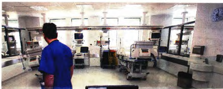
Μέχρι και τις 24 Φεβρουαρίου καταγράφηκαν 316 σοβαρά κρούσματα εργαστηριακά επιβεβαιωμένης γρίπης, εκ των οποίων τα 305 νοσηλεύτηκαν σε ΜΕΘ.

Πιο αναλυτικά, όπως προκύπτει από τα επίσημα επιδημιολογικά δεδομένα, μέχρι και τις 24 Φεβρουαρίου καταγράφηκαν 316 σοβαρά κρούσματα εργαστηριακά επιβεβαιωμένης γρίπης, εκ των οποίων τα 305 νοσηλεύτηκαν σε ΜΕΘ. Από τα 305 περιστατικά που νοσηλεύτηκαν