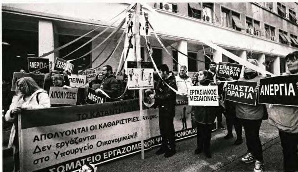
Μαζί με τις εργαζόμενες στην καθαριότητα του μεγαλύτερου αντικαρκινικού νοσοκομείου της χώρας και οι συνάδελφοί τους στο Ψυχιατρικό Νοσοκομείο Αττικής «Δρομοκαΐτειο» , που αντιμετωπίζουν το ίδιο ακριβώς πρόβλημα

Ενδεικτικά ο πρόεδρος της ΠΟΕΔΗΝ περιγράφει πως στο «Δρομοκαΐτειο» οι εργαζόμενες στην καθαριότητα δουλεύουν είτε σπαστά ωράρια -5 ώρες το πρωί και 3 το απόγευμα- με 690 ευρώ τον μήνα, είτε ώρο συνεχόμενο με 490 ευρώ τον μήνα. Τους οφείλονται από 80 ρεπό σε κάθε μία. «Δηλαδή πρέπει