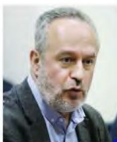
Γιάννης Πάιδας, πρόεδρος της ΑΔΕΔΥ.

Σήμερα η ΑΔΕΔΥ θα πραγματοποιήσει Παναθηναϊκή Στάση Εργασίας από τις 12.00 μ. έως τη λήξη του ωραρίου και συγκέντρω-