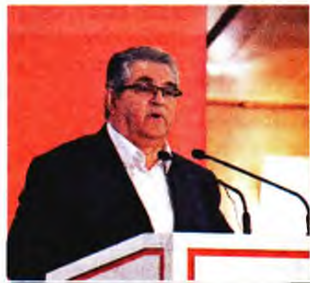
ναζιστική εγκληματική Χρυσή Αυγή, δεν υπήρχε ο κίνδυνος της ακροδεξιάς, του φασισμού;

Όταν συγκυβερνούσε τέσσερα χρόνια με τους ακροδεξιούς ΑΝΕΛ και νομιμοποιούσε στη συνείδηση των λαϊκών ανθρώπων την ακροδεξιά;