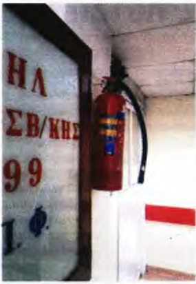
Σύμφωνα με την ΠΟΕΔΗΝ, το ΚΑΤ όχι μόνο δεν διαθέτει πιστοποιητικό πυρασφάλειας, αλλά είχε να γίνει αναγόμευση και συντήρηση των πυροσβεστήρων από το 2016.