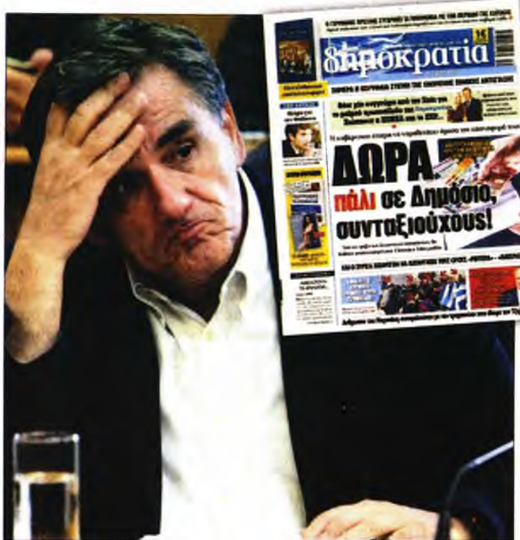
Ο υπουργός Οικονομικών Ευκλείδης Τσακαλώτος στη Βουλή. Ενθετή: Το πρωτοσέλιδο της «δημοκρατίας» στις 2 Μαρτίου

Παράλληλα, το υπό εξέταση χρονικό διάστημα μειώθηκαν από 20% έως 30% οι αμοιβές του δημόσιου τομέα. Εντύπωση προκαλεί η αύξηση κατά 40% των μετακλητών (!), δηλαδή όσων επιλέγονται για να υπηρετήσουν σε θέσεις δίπλα σε υπουργούς ή επικεφαλής υπηρεσιών και φορέων για το χρονικό διάστημα που ασκούν τα καθήκοντά τους. Παρά τις δηλώσεις των στελεχών του ΣΥΡΙΖΑ, προτού αναλάβουν την εξουσία, ότι οι μετα-