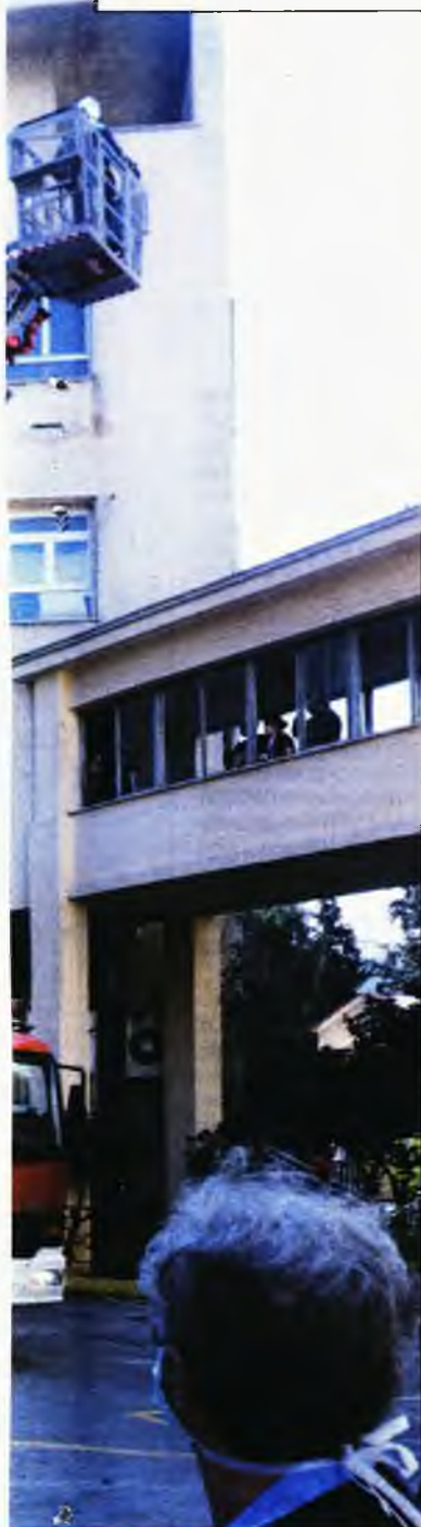
ς στο μαγειτήριο «Ελενα». Ενθετες φω-

ΧΩΡΙΣ ΠΥΡΑΣΦΑΛΕΙΑ είναι τα νοσοκομεία της χώρας, καθώς μόλις 10 δημόσια θεραπευτήρια διαθέτουν το αντίστοιχο ποιοποιητικό, σύμφωνα με καταγγελία της Πανελλήνιας Ομοσπονδίας Εργαζομένων στα Δημόσια Νοσοκομεία (ΠΟΕΔΗΝ).