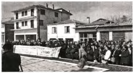
Από τη μαζική συγκέντρωση στα Δίκαια Ορεστιάδας

Σ υγκέντρωση διαμαρτυρίας ενάντια στην υποβάθμιση του Κέντρου Υγείας Δικαίων και της δημόσιας Υγείας γενικότερα, πραγματοποιήθηκε την περασμένη Παρασκευή με πρωτοβουλία του Αγροτικού Συλλόγου Τριγώνου , του Συλλόγου Εργαζομένων στα Κέντρα Υγείας Ορεστιάδας και Δικαίων και της Ομοσπονδίας Αγροτικών Συλλόγων Εβρου «Η Ενότητα» .