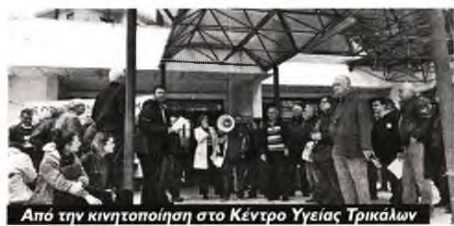
Από την κινητοποίηση στο Κέντρο Υγείας Τρικάλων

Α γωνιστικές κινητοποιήσεις και άλλες δράσεις για τα οξυμένα προβλήματα στο χώρο της Υγείας οργανώνονται στους νομούς της Θεσσαλίας, με αποφάσεις που λαμβάνονται σε συσκέψεις μαζικών φορέων της περιοχής .