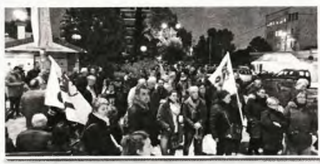
Από τη χτεσινή συγκέντρωση στη Νίκαια

Κ ινητοποίηση στην είσοδο του Νοσοκομείου Νίκαιας, διαμαρτυρόμενοι για τα οξυμένα προβλήματα που αντιμετωπίζει, πραγματοποιήσαν χτες το απόγευμα σωματεία και φορείς του Πειραιά.