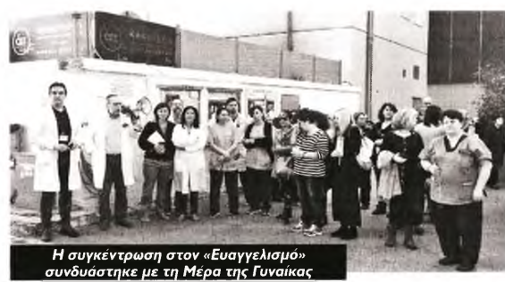
Η συγκέντρωση στον «Ευαγγελισμό» συντάχθηκε με τη Μέρα της Γυναίκας