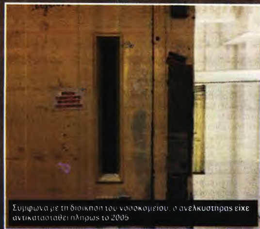
Σύμφωνα με τη διοίκηση του νοσοκομείου, ο ανελκυστήρας είχε αντικατασταθεί πλήρως το 2005