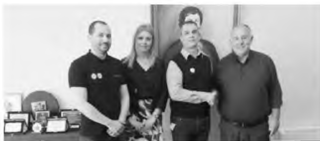
Από την ενημερωτική ημερίδα στο Βελεστίνο

Σύμφωνα με τον Παγκόσμιο Οργανισμό Υγείας, τα δυστυχήματα συγκαταλέγονται μεταξύ των πρώτων αιτιών θανάτου παιδιών ηλικίας έως 18 ετών.