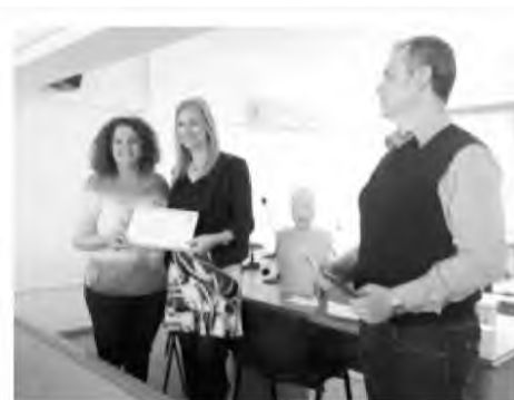
Πιστοποίηση στο προσωπικό των παιδικών σταθμών

Στο τέλος της ημερίδας έγινε η επίδοση των πιστοποιητικών παροχής πρώτων βο-