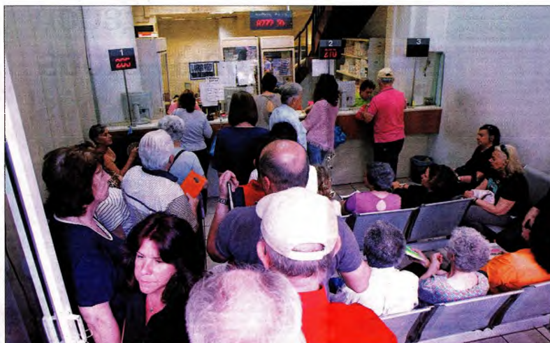
Ομάδες σε φαρμακείο του ΕΟΠΥΥ στην Αθήνα για ιατρούμετα υψηλού κόστους ειδικών παθήσεων (φωτό αρχείου)

Τα νησιά και άλλοι νομοί της χώρας δεν διαθέτουν φαρμακεία του ΕΟΠΥΥ και έτσι η προμήθεια των φαρμάκων γίνεται με αποστολές από τα κεντρικά φαρμακεία του ΕΟΠΥΥ σε Αττική και Θεσσαλονίκη. Η αποστολή των φαρμάκων γίνεται στις διοικητικές υπηρεσίες του ΕΟΠΥΥ κάθε νομού και από εκεί τα παραλαμβάνουν οι ασθενείς» αναφέρεται χαρακτηριστικά στην ανακοίνωση.