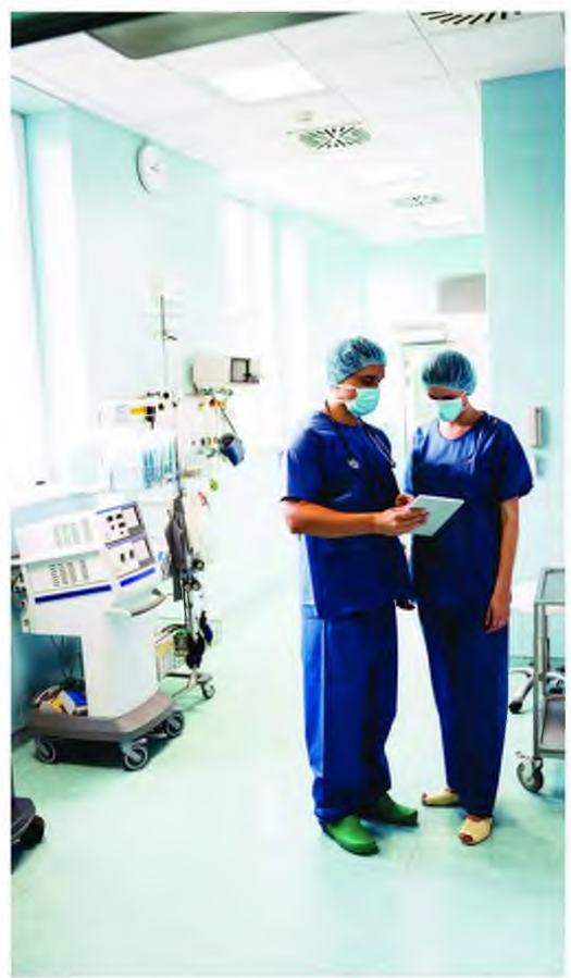
Οι επικείμενες εκλογές και η πιθανή αλλαγή του πολιτικού σκηνικού αποτελούν και βασικά παράμετρο στην απόφαση fund για περαιτέρω επέκταση.

Να αναφέρουμε ακόμη ότι πληροφορίες θέλουν και το CVC, μετά την ολοκλήρωση των διεργασιών για την αφοσίωση και λειτουργική αναδιάρθρωση του επιχειρηματικού σχήματος που έχει προκύψει από τις μεγάλες εξαγορές, να προχωρά σε νέα κίνηση, αλλά μέσα στο 2020. Φαίνεται πως οι επικείμενες εκλογές και η πιθανή αλλαγή του πολιτικού σκηνικού αποτελούν και βασικά παράμετρο στην απόφαση του CVC fund για περαιτέρω επέκταση. Η πρόθεση αυτή δείχνει να επιπράζει αφενός από το τι μέλλει γενέσθαι με το Ντυνάν, όπου φαίνεται πως υπάρχει και πολιτική χροιά στη μη ολοκλήρωση της διαδικασίας του διαγωνισμού, αφετέρου ένας δεύτερος όμως, και ίσως σημαντικότερος, λόγος αφορά τη συνεργασία μεταξύ ιδιωτικού και