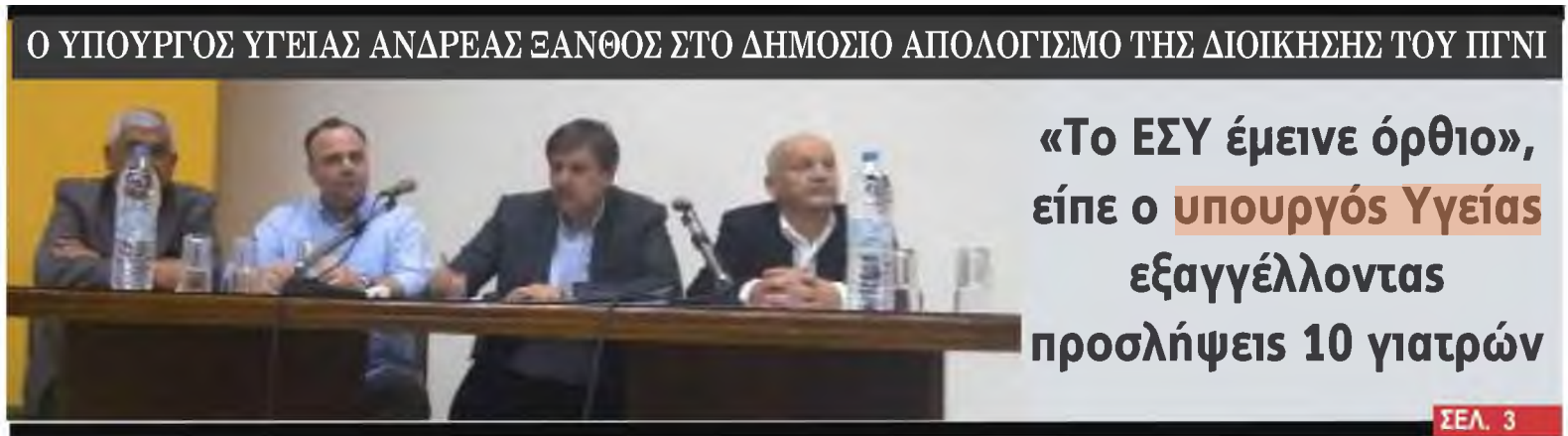
Ο ΥΠΟΥΡΓΟΣ ΥΓΕΙΑΣ ΑΝΔΡΕΑΣ ΞΑΝΘΟΣ ΣΤΟ ΔΗΜΟΣΙΟ ΑΠΟΛΟΓΙΣΜΟ ΤΗΣ ΔΙΟΙΚΗΣΗΣ ΤΟΥ ΠΓΝΙ

«Το ΕΣΥ έμεινε όρθιο», είπε ο υπουργός Υγείας εξαγγέλλοντας προσλήψεις 10 γιατρών