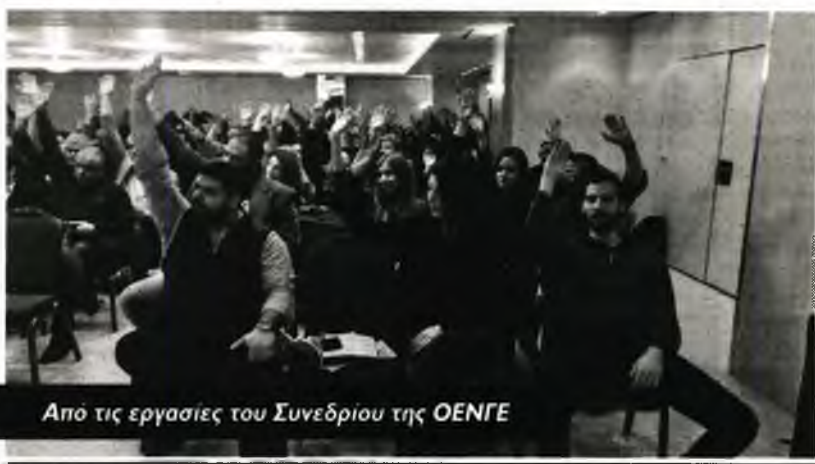
Από τις εργασίες του Συνεδρίου της ΟΕΝΓΕ

Το πρώτο μέρος του Συνεδρίου ολοκληρώθηκε το Σάββατο με ο-