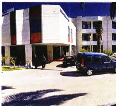
Από το νοσοκομείο Κεφαλονιάς παραιτήθηκαν και δύο παθολόγοι, με αποτέλεσμα να είναι επισφαλής η λειτουργία και της παθολογικής κλινικής.

►► ΝΟΣΟΚΟΜΕΙΟ ΚΕΦΑΛΛΟΝΙΑΣ: ΠΑΡΑΙΤΗΘΗΚΑΝ ΜΑΖΙ ΚΑΙ 4 ΑΠΟ ΤΙΣ 5 ΣΥΝΟΛΙΚΑ ΝΟΣΗΛΕΥΤΡΙΕΣ