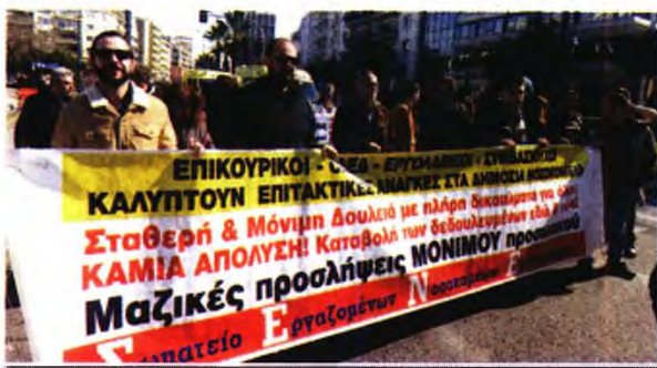
γκάλωση των πραγματικών αιτιών αλλά και των υπαίτιων των προβλημάτων στην Υγεία».

Και συνεχίζει: Τα καθημερινά προβλήματα που αντιμετωπίζουν και οι εργολαβικοί είναι η υπερεντατικοποίηση της εργασίας λόγω έλλειψης του αναγκαίου προσωπικού. Απληρώτες υπερφορμές και διπλοβάρδιες. Καθυστερήματα των δεδουλευμένων σε μόνιμη βάση. Ανάληψη καθηκόντων με ελλιπή εκπαίδευση και σε λιγότερο