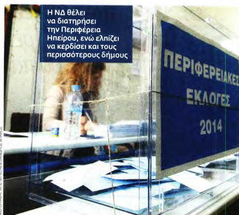
Η ΝΔ θέλει να διατηρήσει την Περιφέρεια Ηπείρου, ενώ ελπίζει να κερδίσει και τους περισσότερους δήμους

Στα Γιάννενα η κατάσταση για τη ΝΔ ήταν εξίσου αρνητική, αν και σε αυτοδιοικητικό πεδίο έχει καλύτερα αποτελέσματα (ελέγχει τη Νομαρχία Ιωαννίνων από το 2002 έως το 2010 με τον Αλέκο Καρχιμάνη , ο οποίος είναι σήμερα, όντας δύο φορές περιφεράρχης, τα διαστήματα 2010-2014 και 2014-2019, και πάλι υποψήφιος). Ο ΣΥΡΙΖΑ κατάφερε να πάρει την πρώτη το 2015, εκλέγοντας τέσσερις βουλευτές με ποσοστό που προσέγγιζε το 40%, ενώ η ΝΔ έπεσε κάτω από