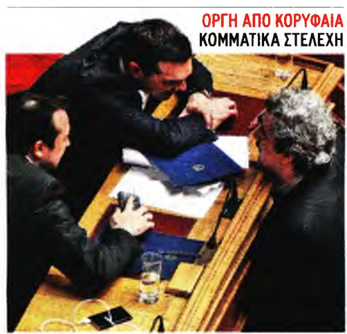
ΟΡΓΗ ΑΠΟ ΚΟΡΥΦΑΙΑ ΚΟΜΜΑΤΙΚΑ ΣΤΕΛΕΧΗ