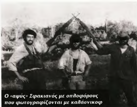
Ο «αψύς» Σρακιανός με οπλοφόρους που φωτογραφίζονται με καλάσνικοφ

«Οι κομμουνιστές την ψ@λή την έχουν μόνο για να κατουράνε...»