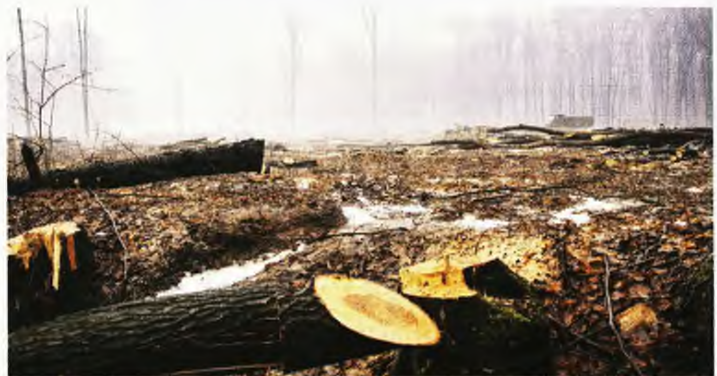
Οι επιστήμονες κρούουν τον κώδωνα του κινδύνου επισημαίνοντας ότι δεν υπάρχουν άλλα περιθώρια καθυστέρησης και θα πρέπει να υπάρξουν άμεσα δραστικά μέτρα για την προστασία του περιβάλλοντος.

Η πανίδα και η χλωρίδα του πλανήτη μας κινδυνεύουν με εξαφάνιση! Καμπανάκι κινδύνου κρούουν οι επιστήμονες, με μια έκθεση-κόλαφο για την αδιαφορία του ανθρώπινου παράγοντα απέναντι στη μεγάλη καταστροφή που συντελείται γύρω μας, στο περιβάλλον. Το ίδιο το ανθρώπινο γένος θα κινδυνεύσει αν δεν ληφθούν μέτρα, προειδοποιούν οι επιστήμονες στη νέα έκθεση του ΟΗΕ, που τονίζει ότι 1 εκατομμύριο είδη είναι υπό εξαφάνιση: θηλαστικά, αμφίβια, πτηνά κινδυνεύουν να χαθούν από τον πλανήτη λόγω της ανθρώπινης δραστηριότητας.