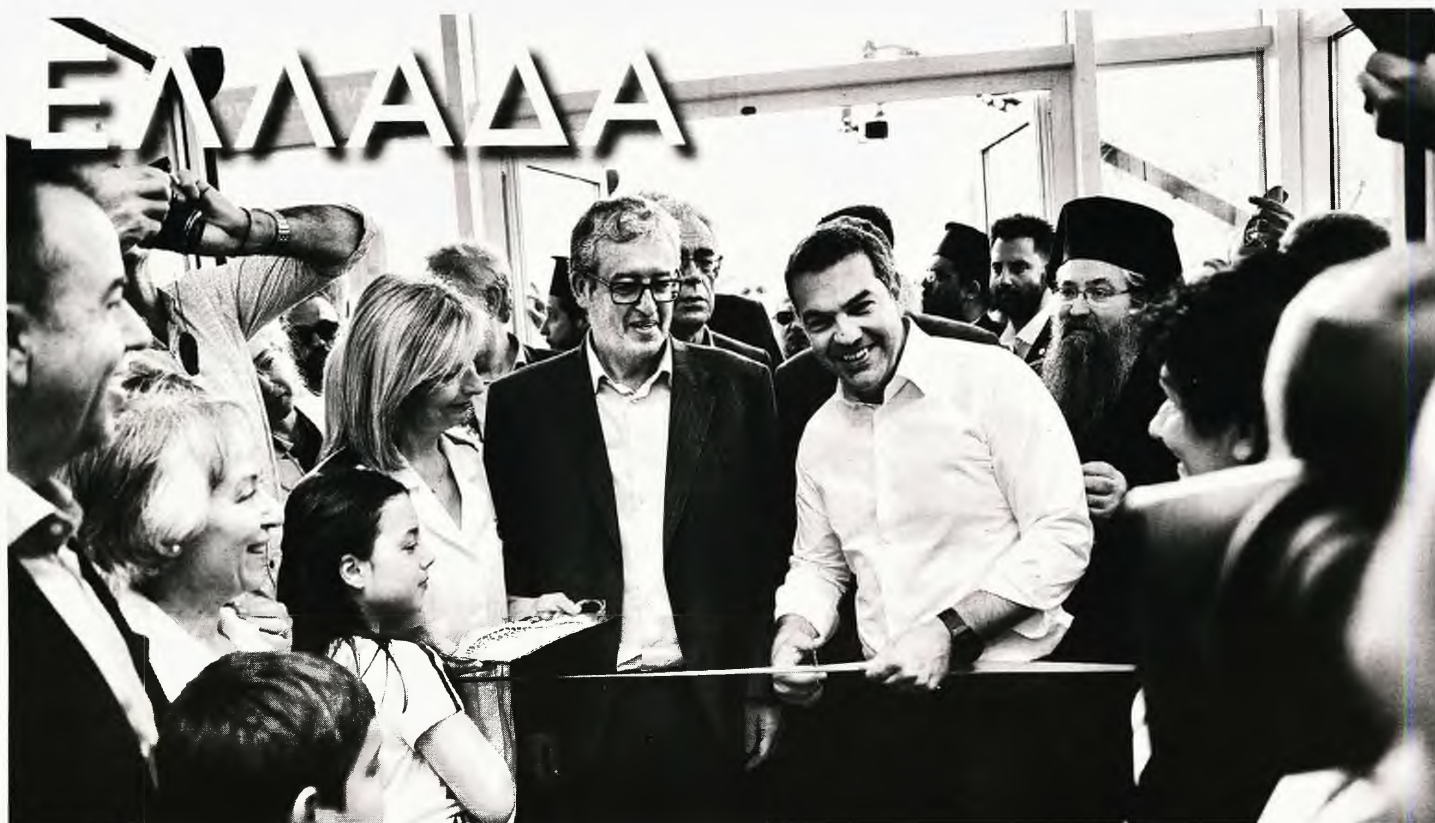
ΤΣΙΠΡΑΣ: ΚΟΡΔΕΛΑ ΣΤΟ ΝΟΣΟΚΟΜΕΙΟ ΛΕΥΚΑΔΑΣ ΚΑΙ Η ΑΛΗΘΕΙΑ ΠΙΣΩ ΑΠΟ ΤΙΣ ΕΞΑΓΓΕΛΙΕΣ