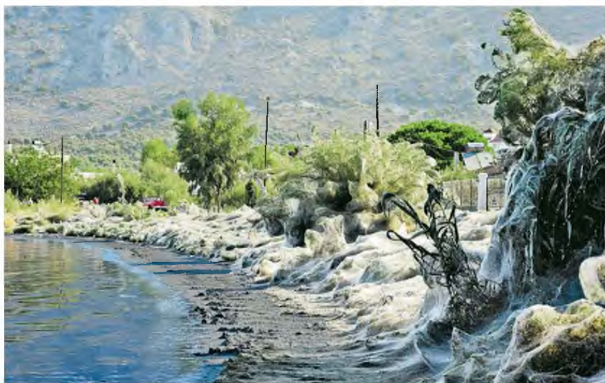
Το τεράστιο «πέπλο» από ιστούς αράχνης είχε καλύψει τα φυτά σε παραλία στο Αιτωλικό το περασμένο καλοκαίρι. Οι ειδικοί είχαν αποδώσει το φαινόμενο στην αύξηση των κουνουπιών, που αποτελούν τροφή για τις αράχνες.