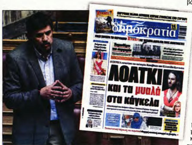
Ο υπουργός Υγείας Ανδρέας Ξανθός. Δεξιά: Το πρωτοσέλιδο της «δημοκρατίας» στις 3 Απριλίου 2019

■ Το υπουργείο Υγείας τάζει προεκλογικά αλλαγή φύλου στα δημόσια νοσοκομεία με λεφτά των Ελλήνων φορολογούμενων