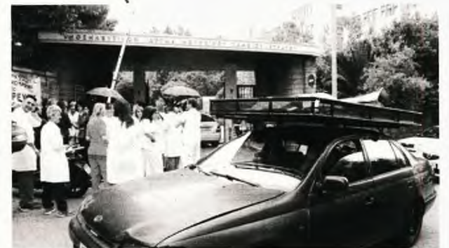
Ο τσιγγάνος σκραπιτζής κατάλαβε ότι όλα είναι υπό διάλυση στα νοσοκομεία και βγήκε να μαζέψει τις... λαμαρίνες...