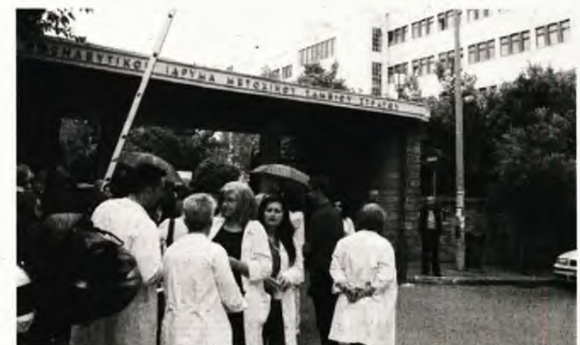
Η αγωνία έκδηλη για το μέλλον της υγείας στη χώρα μας, από τους ίδιους τους εργαζόμενους, γιατρούς, νοσηλευτές και τεχνικούς. Η κυβέρνηση βάζει πλάτη για την ολοκληρωτική καταστροφή των δημόσιων νοσοκομείων...