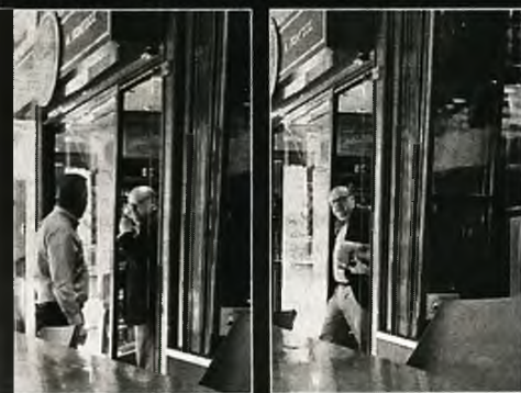
«Πήρε και τα πούρα του... Στην υγεία των κορβίδων». Αναγνώστης