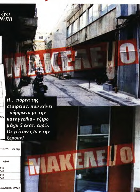
Η... πορτα της εταιρείας, που κάνει -σύμφωνα με την καταγγελία- τζίρο μέχρι 5 εκατ. ευρώ. Οι γείτονες δεν την ξέρουν!

Συνομοσπονδία Νοσηλευτών ΕΣΥ... Πιο συγκεκριμένα, για τον διοικητή έχουν γραφτεί μεταξύ άλλων τα εξής: ■ Οτι διορίστηκε στο «Γ. Γεννηματάς» με «εντολή» του φίλου του, όπως λένε, Παύλου Πολάκη. ■ Τον έχουν χαρακτηρίσει και ως «άνθρωπο» του Νικήτα Κακλαμάνη. Σύμφωνα με το ΦΕΚ με αριθμό Φύλλου 216 και ημερομηνία 1 Σεπτεμβρίου 2005 επί των ημερών του Νικήτα Κακλαμάνη, διορίστηκε πρόεδρος στο ΕΚΑΒ! - ■ Στην «καρμανλική» Δεξιά στην οποία έχει κάνει ανοίγματα από την αρχή ο Αλέξης Τσίπρας. Στην τοποθέτησή του στη διοίκηση του νοσοκομείου, είχε πει «ναι» και το κόμμα του Πάνου Καμμένου, οι ΑΝΕΛ. ■ Πρόσφατα δέχθηκε έντονη κριτική από την Πανελλήνια Συνομοσπονδία Νοσηλευτών ΕΣΥ (ΠΑΣΥΝΟ-ΕΣΥ) για την απομάκρυνση της μέχρι πρότινος Προισταμένης Νοσηλευτικής Διεύθυνσης του νοσοκομείου «Γ. Γεννηματάς».