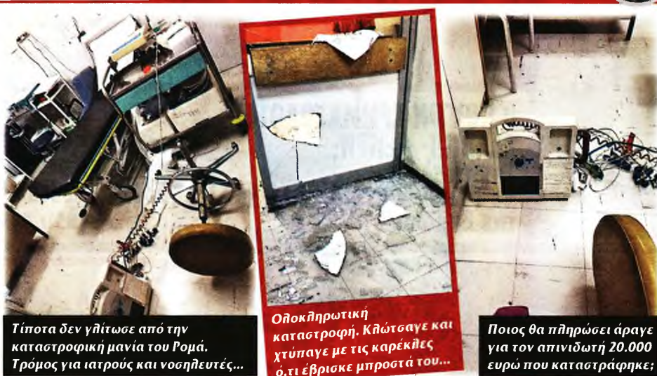
Τίποτα δεν γλίτωσε από την καταστροφική μανία του Ρομά. Τρόμος για ιατρούς και νοσηλευτές...