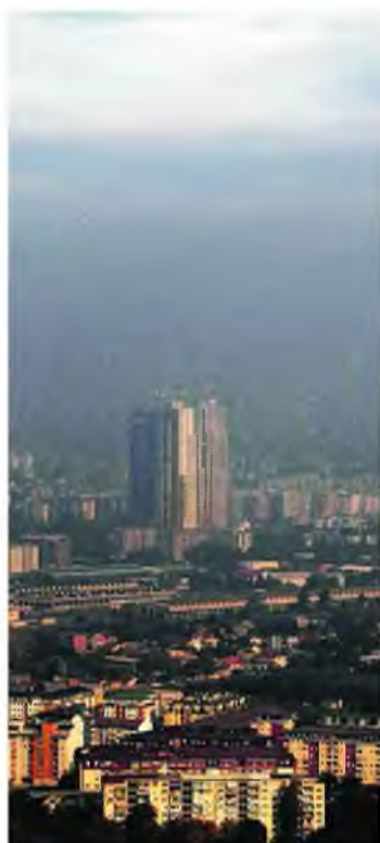
Πέπλο ρύπανσης πάνω από την πόλη των Σκοπίων.

ΓΕΝΕΥΗ. Επικίνδυνα επίπεδα ατμοσφαιρικής ρύπανσης, τα οποία μειώνουν το προσδόκιμο ζωής, πλήττουν τους κατοίκους όλων των πόλεων των Δυτικών Βαλκανίων. Η ρύπανση αυτή οφείλεται κυρίως σε απαραίτητα εργασιάζα καύσης άνθρακα για την παραγωγή ηλεκτρικού.