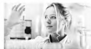
Τη διαγραφή του clawback ζήτησαν από τον υπουργό Υγείας οι φορείς

Ήδη, όμως, οι δαπάνες έχουν καθοριστεί και για το 2019, για όλες τις παροχές του ΕΟΠΥΥ, ενώ για τις διαγνωστικές εξετάσεις θα δοθούν επιπλέον 9 εκατ. ευρώ.