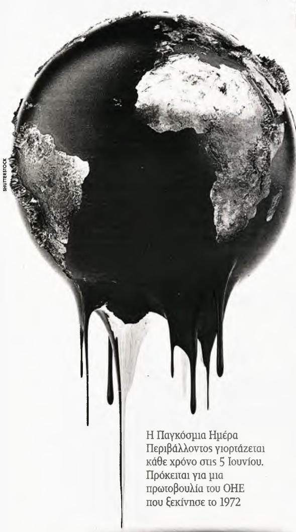
Η Παγκόσμια Ημέρα Περιβάλλοντος γιορτάζεται κάθε χρόνο στις 5 Ιουνίου. Πρόκειται για μια πρωτοβουλία του ΟΗΕ που ξεκίνησε το 1972

Σε αυτόν την περίπτωση η απώλεια της φύσης θα είναι μεταξύ των μη αναστρέψιμων συνεπειών που η ανθρωπότητα θα κληθεί να αντιμετωπίσει, με ό,τι αρνητικό συνεπάγεται για την κοινωνία, το περιβάλλον και την οικονομία.