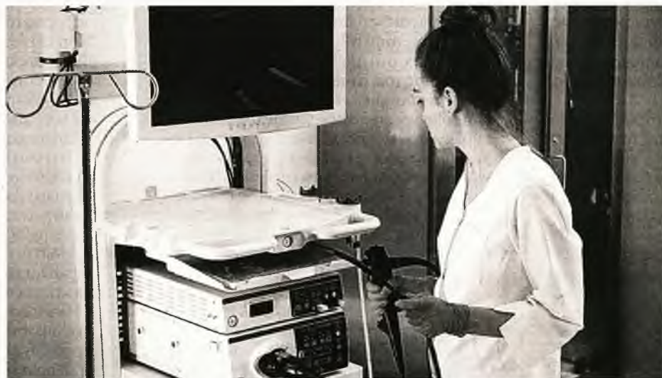
Τα εργαστήρια θα είναι ανοικτά τις απογευματινές ώρες προκειμένου να παραδίδουν αποτελέσματα εξετάσεων που έχουν ήδη διενεργηθεί

Ο ίδιος δε, δίνει ιδιαίτερη έμφαση στην πάγια τακτική του υπουργείου Υγείας να νομοθετεί κοινωνικά μέτρα, φορτώνοντας το κόστος στις πλάτες του ιδιωτικού τομέα. «Πρόσφατο παράδειγμα είναι η μηδενική συμμετοχή σε διαγνωστικές εξετάσεις για ασθενείς με σοβαρά νοσήματα όπως είναι η μεσογειακή αναιμία, η κυστική ίνωση, οι νεφροπαθείς τελικού σταδίου κ.ο.κ. Όμως, παρότι το μέτρο είναι σωστό, δεν έχει προβλεφθεί επιπλέον κονδύλι. Αντιθέτως, ακόμη και στην αιτιολογική έκθεση σημειώνεται ότι η μαύρη τρύπα που θα προκύψει στον ΕΟΠΥΥ θα καλυφθεί από το clawback».