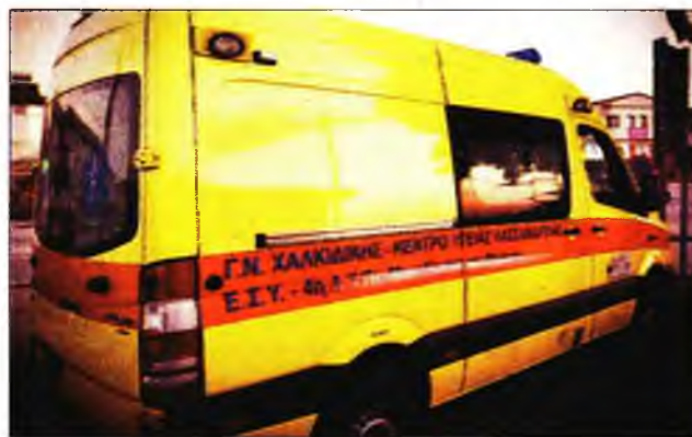
Το ασθενοφόρο του Ιατρικού Κέντρου Κασσάνδρας

«Στο τριήμερο του Αγίου Πνεύματος, σε μια Κασσάνδρα που έχει αρχίσει να βουλιάζει από κόσμο, βάρ-