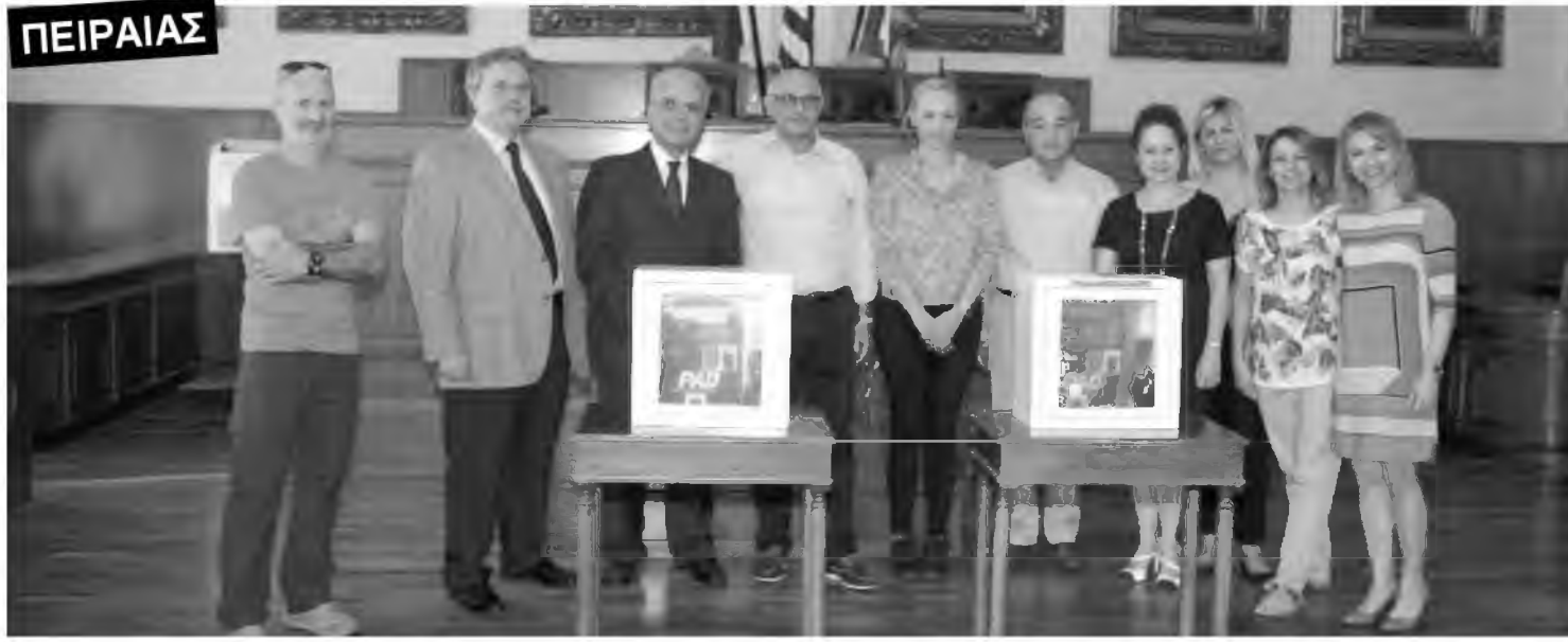
Φωτογραφικό στιγμιότυπο από την παράδοση των απινιδωτών