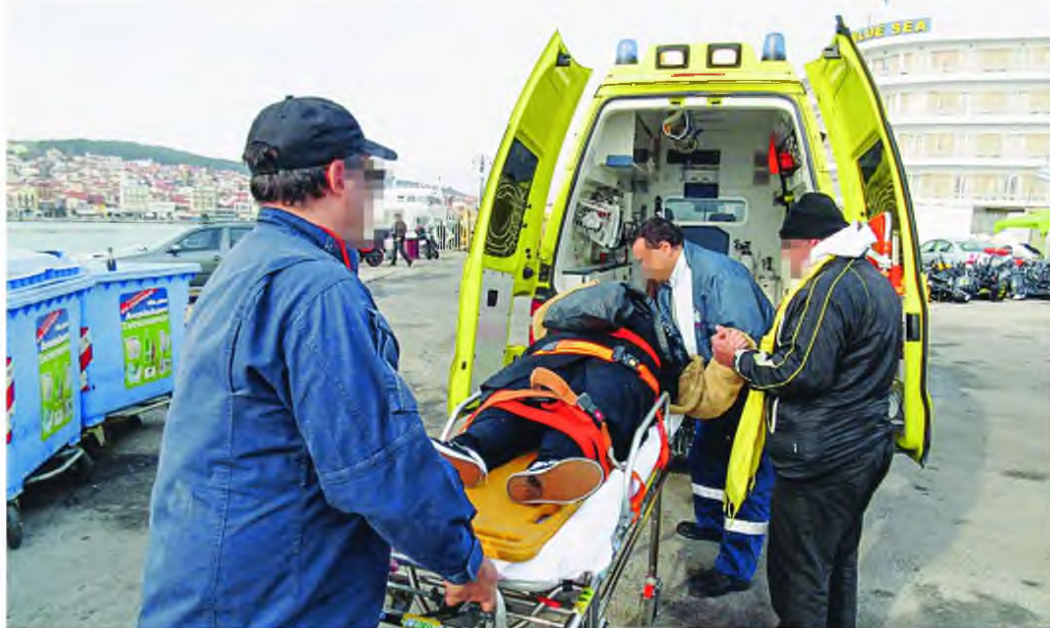
Ιδιαίτερα σημαντική η υποστελέχωση του ΕΚΑΒ σε διασώστες, καθώς η έλλειψή τους δημιουργεί σοβαρά προβλήματα τόσο για τους ντόπιους κατοίκους όσο και για τους τουρίστες

ΚΩΣ: Στο νησί επιχειρεί ένα ασθενοφόρο σε κάθε βάρδια. Πολλές ημέρες τον μήνα η βάρδια 3 - 11 μένει ακάλυπτη,