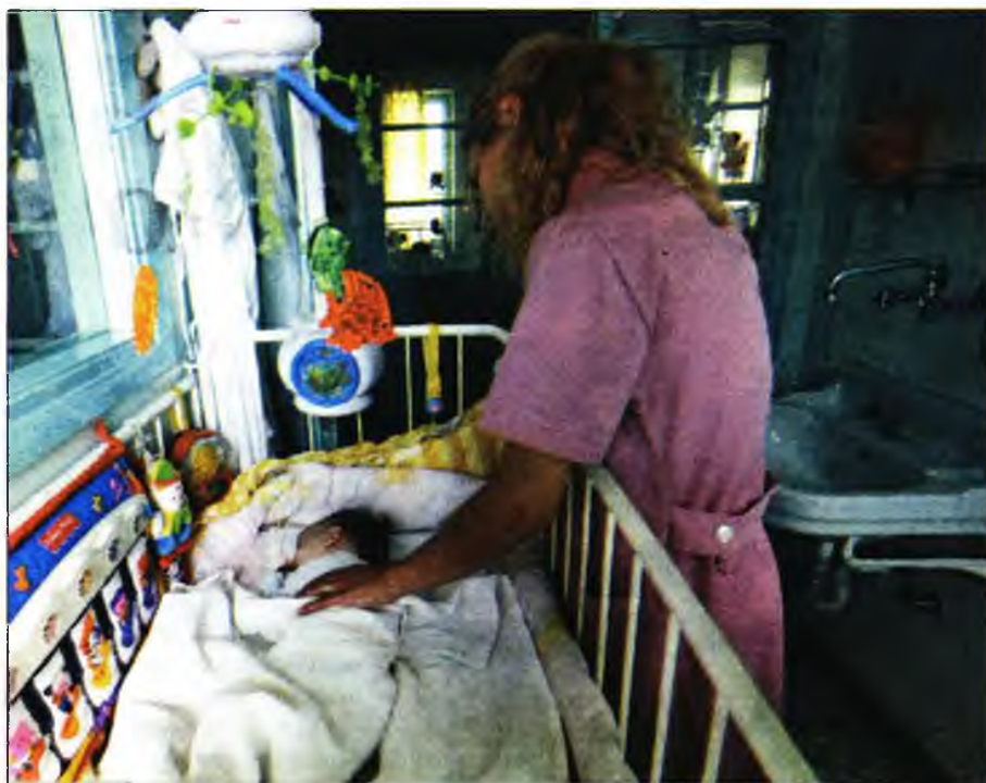
Στιγμιότυπο αρχείου από το Κέντρο Βρεφών «Η Μπτέρα»

Το σωματείο εργαζομένων στο κέντρο βρεφών σε ανακοίνωσή του αναφέρει ότι αντί να γίνουν προσλήψεις, όπως είχαν υποσχεθεί η υπουργός Εργασίας Εφη Αχτσιόγλου και η αναπληρώτρια υπουργός Κοινωνικής Αλληλεγγύης Θεανώ Φωτίου κατά την επίσκεψή τους στο κέντρο στις 18 Απριλίου 2019 για να εγκαινιάσουν τη λειτουργία της ηλεκτρονικής πλατφόρμας για την αναδοχή και την υιοθε-