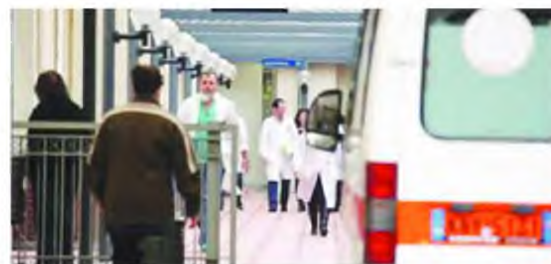
Η Πανελλήνια Ομοσπονδία Εργαζομένων Δημοσίων Νοσοκομείων καταγγέλλει την καθυστέρηση στις διαδικασίες προσλήψεων

στον ωκεανό» την προκήρυξη 5Κ/2018 η οποία περιλάμβανε 37 θέσεις διασωστών στο ΕΚΑΒ – με τις 8 θέσεις να αφορούν σε νησιά με υποστελεχωμένες υπηρεσίες ΕΚΑΒ (Ικαρία 1, Κάλυμνος 1, Κως 2 και Ρόδος 4). «Η έκδοση των οριστικών αποτελεσμάτων πάει για μετά τις εκλογές. Η πρόσληψή τους σύμφωνα για μετά το καλοκαίρι» τονί-